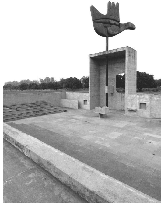
Рис 2. Монумент «Відкрита рука» Ле Корбюз'є. Індія, Чандігарх 1950-1965 р.