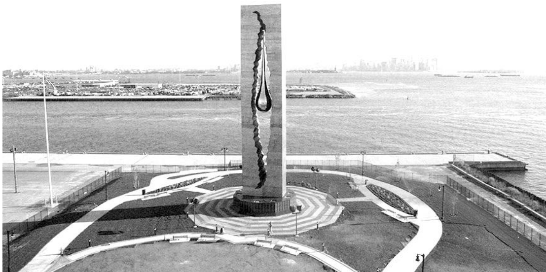
Рис 3. Монумент «Слеза скорби». З. Церетелі. США, Нью-Джерсі 2006 р.