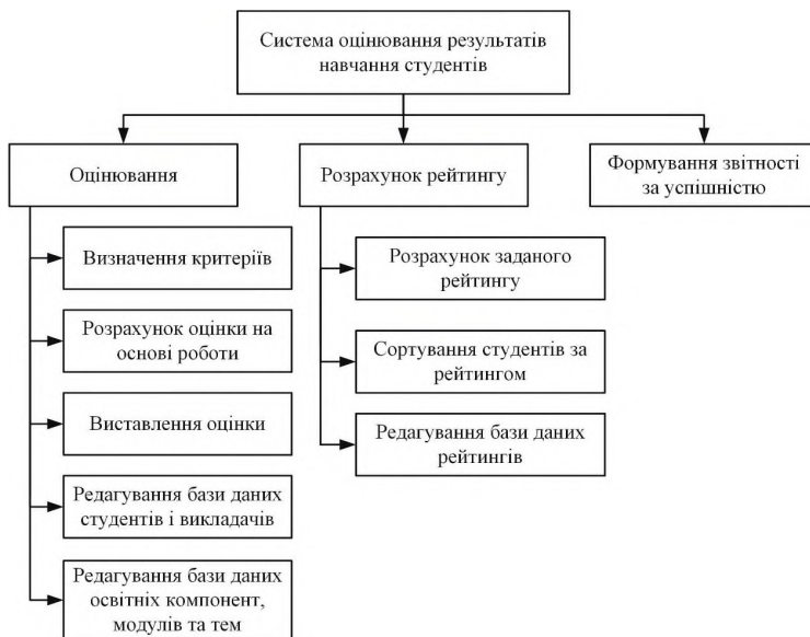
Рис. 2. Дерево функцій системи оцінювання результатів навчання

Розглянемо детальніше кожен функцію розробленої системи: