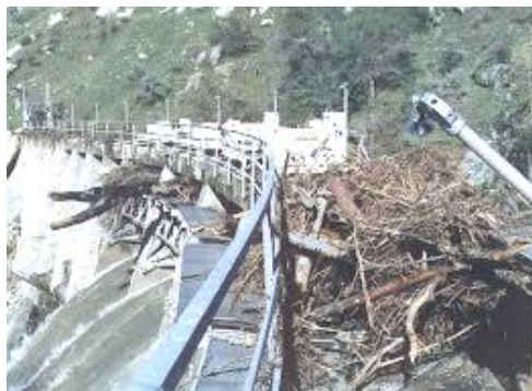
Блокування водоскиду греблі Керкхоф в 1997 р. (р. Сан Хоакін, Каліфорнія, США)