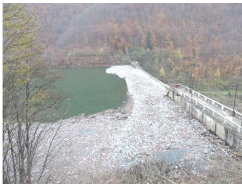
Накопичення сміття у верхньому б'єфі греблі Теремля-Рікської ГЕС (р. Теремля, Україна)

– неготовність водоскидів до виконання функцій пропуску води через невиконання в повному об'ємі необхідних ремонтно-відновлювальних робіт; слід зазначити, що стан неготовності різних водопропускних споруд гідровузлів, що в цілому формують водоскидні фронти, в тому числі і неготовність протягом тривалого часу, не є рідкісним явищем на вітчизняних гідровузлах; так, наприклад, за оцінками, наведеними в [9], тривалість стану неготовності частини водопропускних споруд Київського гідровузла, що мають використовуватися при скиді розрахункового паводку, в деякі роки досягала кількох місяців, причому інколи ремонтно-відновлювальні роботи на водопропускних спорудах виконувалися і під час пропуску паводків.