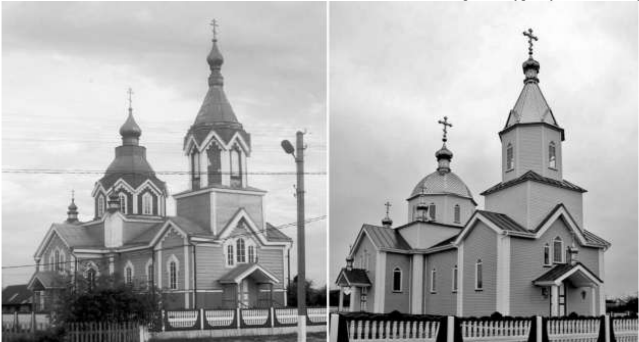
Рис. 4. С. Пульмо, Волинська обл. Церква Св. Миколая, 1895 р. (ох. № 215-м): а) загальний вигляд до проведення ремонтних робіт; б) сучасний вигляд, фото 2012 р.