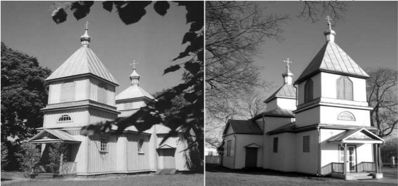
Рис. 2. С. Кураш, Рівненська обл. Свято-Преображенська церква, XVIII ст., перебудована в 1887 р. (ох. № 190087): а) загальний вигляд до проведення ремонтних робіт, фото А. Мізерного, 1997 р.; б) сучасний вигляд, фото О. Смолінської, 2009 р.