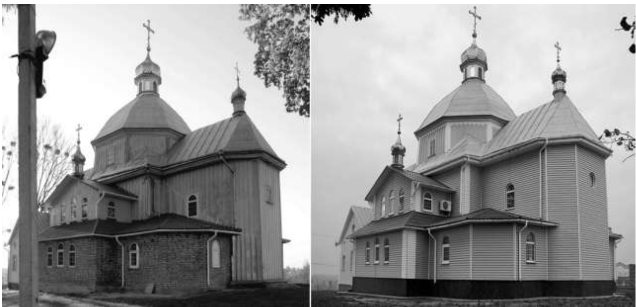
Рис. 5. С. Обарів, Рівненська область. Свято-Покровська церква, 1781 р. (ох. № 1519-Н): а) загальний вигляд до проведення ремонтних робіт, фото П. Ричкова, 2007 р.; б) сучасний вигляд, фото А. Власенка, 2013 р.