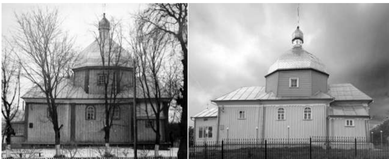
Рис. 1. С. Корнин, Рівненська обл. Церква Св. Миколая, 1-ша пол. XVIII ст. (ох. № 1518-Н/1): а) загальний вигляд до проведення ремонтних робіт, фото 1983 р.; б) сучасний вигляд, 2010 р.

Висновки. З вищевикладеного можна констатувати, що поширення подібних ремонтних технологій з використанням вінілового сайдингу зараз перетворилося на серйозну загрозу наявній спадщині дерев'яного храмовбудування, і не лише на Волині. Слід визнати, що навіть наявність пам'яткоохоронного статусу подібних будівель не рятує їх від непоправних втрат. Проблема, вочевидь, вкорінена в загальному легковажному ставленні суспільства до культурних надбань минулого. Подолання такого реноваційного нігілізму наполегливо вимагає вжиття комплексу заходів на різних рівнях управління – державному, громадському, церковному. У першу чергу, сама Церква має усвідомити вагомість і гостроту назрілої проблеми.