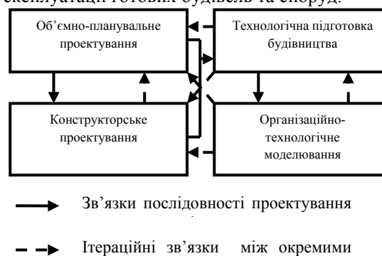
Рис.1. Принципова схема зв'язків між видами проектування

Ще в 60-х роках двадцятого сторіччя були зроблені перші кроки в напрямку шляхів сумісного розв'язання задач, що враховують критерії та обмеження, які виникають в процесі підготовки та прийняття об'ємно-планувальних, конструктивних, технологічних та організаційних рішень в будівництві. В роботі [12] було визначено, що різні рішення, які приймаються на різних стадіях проектування будівель та підготовки процесів будівництва, повинні: по-перше, враховувати цілі та обмеження, які виникають із специфіки об'ємно-планувального, конструктивного, технологічного та організаційного проектування; по-друге, враховувати ітераційні цикли підготовки та прийняття таких рішень на різних етапах життєвого циклу проектування та створення готової будівельної продукції. Розвиток цих ідей дозволив визначити деякі можливі напрямки модельної інтеграції знань різних предметних підобластей в будівництві. На принциповій схемі (рис.1) наведено взаємозв'язки між цими видами рішень в процесі проектування будівель, підготовки будівельного виробництва, управління будівництвом та експлуатації готових будівель та споруд.