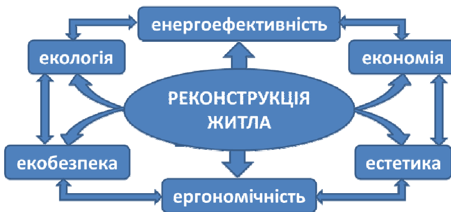
Рис. 3. Основні вимоги до процесу реконструкції житлового фонду (концепція 6E)

Незважаючи на бурхливий розвиток інновацій у сфері енергоефективності, використання нових технологій значно обмежене внаслідок їх високої вартості та складностей процесу експлуатації. Всі ці недоліки нівелюються при збільшенні масштабів виробництва та масовому застосуванні, тому вкрай важливо поширювати інноваційні екоенергоефективні технологічні досягнення серед верств населення з високим фінансовим статком, а також забезпечувати суттєву підтримку на державному рівні. Такий підхід сприяє підвищенню якості та зниженню вартості енергоефективних технологій, що дозволить у майбутньому широко використовувати прогресивні інновації всім громадянам, незалежно від їх статку. Екоенергоефективна реконструкція повного циклу дозволяє досягти нульового і навіть прибуткового енергетичного балансу будівель. Для покращення процесу реконструкції житла запропоновано концепцію 6E, що акцентує увагу на енергоефективності, екобезпеці, економії, екології, ергономічності та естетиці процесу реконструкції житлових споруд (рис. 3).