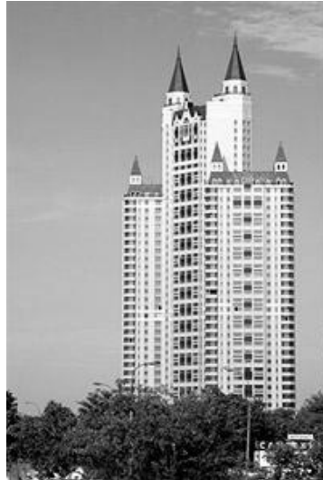
Рис. 7. Житловий комплекс «Едельвейс» у Москві

Моспроект – 2, арх. П. Андрєєв, В. Ковшель, В. Солонкін, 2000 – 2001 рр.