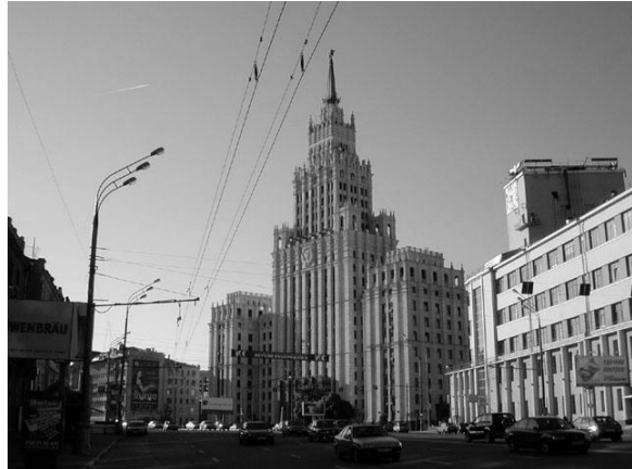
Рис. 2. Адміністративна споруда біля станції метро «Красные ворота» у Москві

арх. А.Душкін, Б.Мезенцев, В.Абрамов, 1953 р.