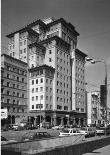
Рис. 6. Адміністративний будинок на Долгоруківській вулиці у Москві

Моспроект – 2, арх. П. Андрєєв, В. Ковшель, В. Солонкін, 2000 – 2001 рр.