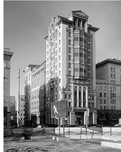
Рис. 8. Адміністративний будинок на вул. Перша Тверська-Ямська у Москві

Будівельна компанія «Спец-Высот-Строй» 2000 – 2003 рр.