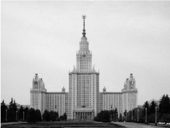
Рис.1. Спорда Московського державного університету на Воробйових горах у Москві арх. Л.Руднев, С.Чернишов,

вулиць і на вигинах Москви-ріки – на найважливіших планувальних вузлах. Проте, роль висотних споруд була набагато важливіша, ніж просто містобудівельна домінанта. В СРСР висотні будинки стали предметом ідеології. Помпезність, орієнтація на вічність, театральність і натхненність втілювали ідеї комуністичної квазірелігії. Символічною була присутність російської історії в їх архітектурі. Сталінські висотки стали символом домінування Москви, метафорою могутності надімперії [3].