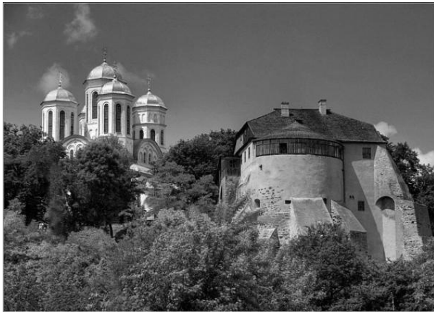
Рис.4. Мурована вежа

Острозький замок, в стінах якого розташовувалася академія, - унікальний фортифікаційний комплекс, який зберігся до нашого часу. Сьогодні на території Острозького замку розташовано Острозький краєзнавчий музей. В ансамбль замку входять сьогодні чотири основних будівлі: Мурована вежа (Рис. 4), Богоявленський собор (Рис. 5), Кругла вежа (Рис. 6), та Надбрамна башта, яка з 1905 року була переобладнана в дзвінницю (Рис. 7).