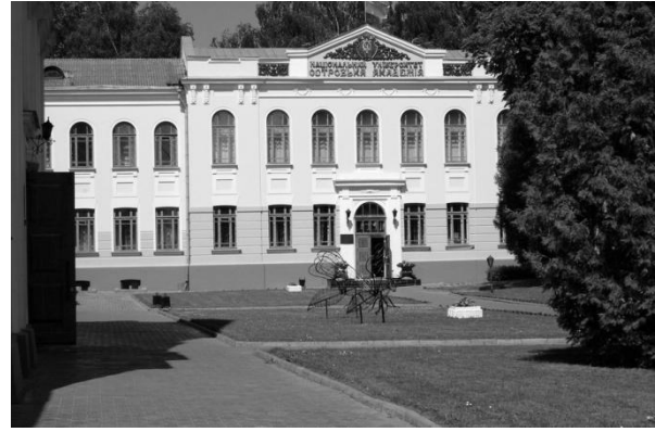
Рис.10. Головний корпус академії