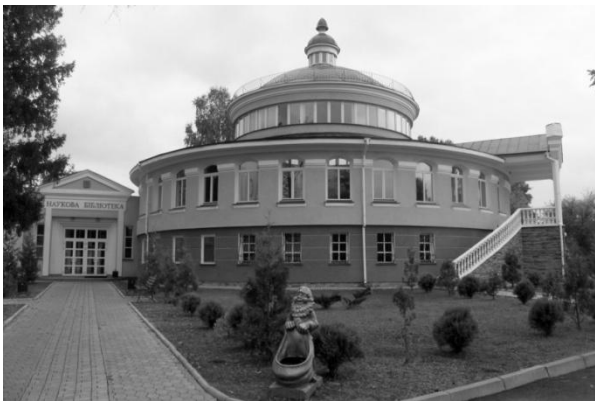
Рис.11. Наукова бібліотека