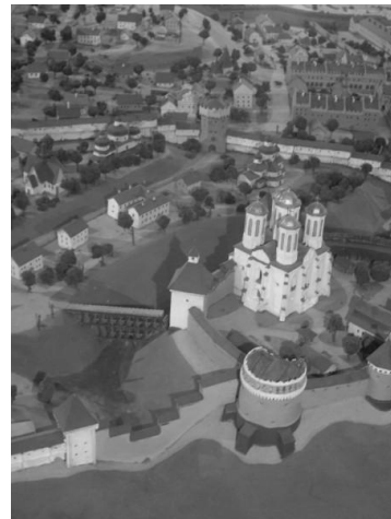
Рис.2. Макет Острозького замку

Експлікація споруд Острозької академії: 1) Богоявленський собор; 2) вхідні ворота-башта; 3) оборонні вежі; 4) оборонні стіни; 5) навчальні приміщення; 6) житлові приміщення; 7) господарська споруда; 8) учбово-спортивні майданчики; 9) під'їздний міст.