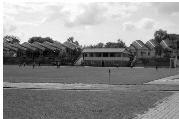
Рис.14. Спортивні споруди

Частину будівель, де сьогодні знаходиться Острозька академія, було зведено у другій половині XVIII ст. і вони належали ордену капуцинів. В 1750 році князь Януш Сангушко, ординат Острозький, надав землі за валами Острога при дорозі на Дубно на будівництво капуциньського монастиря. У цьому ж році почалося будівництво. Автором проекту був архітектор Павло Антоні Фонтана. До комплексу монастиря увійшов костел та корпус келій, прибудований до костелу, а також господарські будівлі. Костел (сьогодні студентсько-