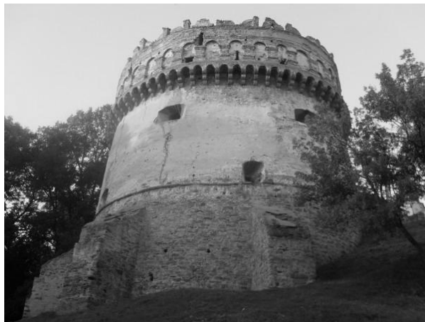
Рис.6. Кругла вежа