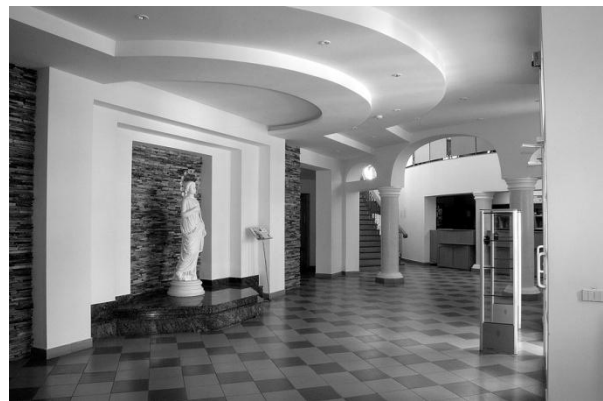
Рис.12. Інтер'єр бібліотеки