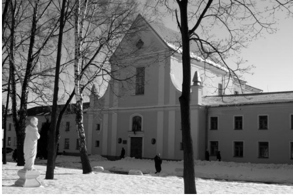
Рис.8. Студентсько-викладацьких храм