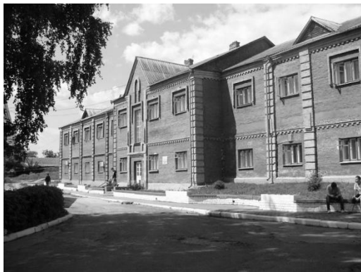
Рис.13. Студентський гуртожиток