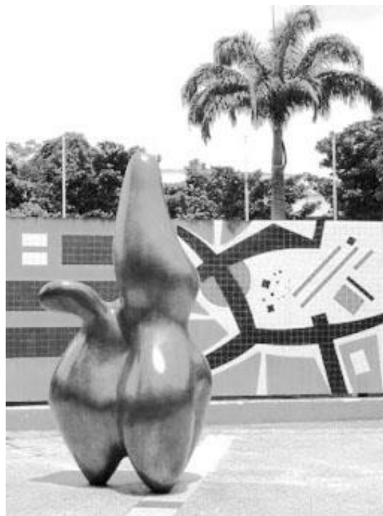
Рис 2. Керамічний стінопис і декоративна скульптура. Каракасський університет, Венесуела. 1953 р.