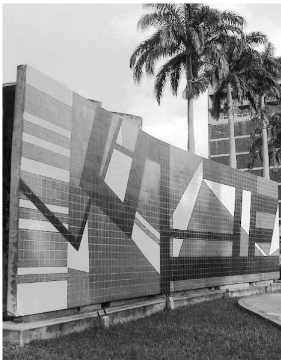
Рис. 1. Керамічний стінопис. Каракасський університет, Венесуела. 1953 р.