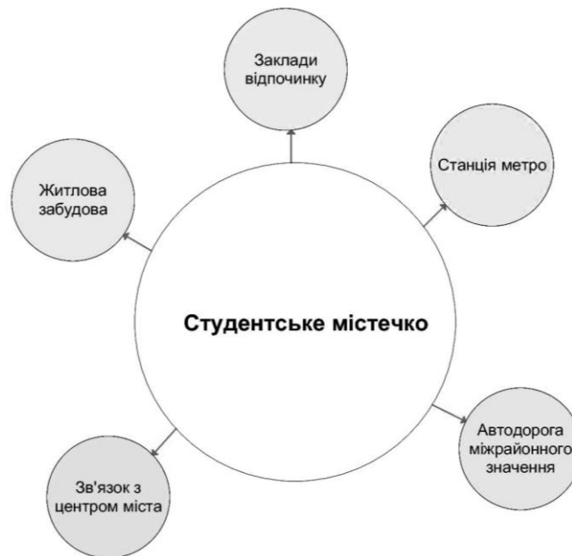
Схема 1. Принцип функціонально-просторової інтеграції

Принцип екологічності та ландшафтного кооперування полягає в забезпеченні території ВНЗ або науково – освітнього центру зеленою зоною, що дозволяє відмежувати цю територію від транспорту, центрів скупчення великої кількості людей, пустирів тощо (схема 2). Створення зеленої зони на територіях вищих навчальних закладів є необхідною складовою підвищення якості умов навчання студентів і праці науковців та сприяє їх загальному психологічному розвантаженню. Насадження на таких територіях відіграють також санітарно-гігієнічну, архітектурно-планувальну та естетичну функції, проте основним є створення комфортних мікрокліматичних умов. Зелена зона ВНЗ може складатися з парків, алей, скверів і просто зелених насаджень вздовж території.