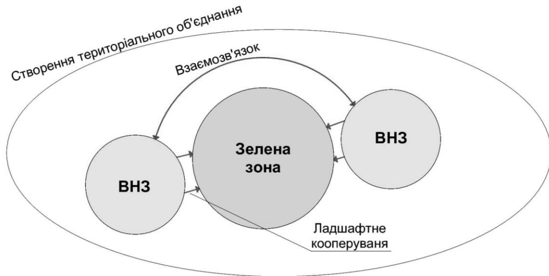
Схема 3. Принцип ландшафтного кооперування – варіант №2

Принцип адаптивного кооперування полягає в поєднанні двох закладів одного профілю у кооперацію і тим самим створення нового більш масштабного закладу (схема 4). Таке об'єднання двох однакових або схожих за профілем закладів покращує їх зв'язок з практичної точки зору, дозволяє використовувати спільні приміщення, створювати та будувати спільні заклади, приміщення спеціального наукового профілю тощо. В такій кооперації адаптуванню підлягає здебільшого будівлі закладів, що поєднуються, та їх територія. Створюються додаткові дорожні розв'язки, пішохідний простір та велосипедні доріжки на території закладів, якщо вони є.