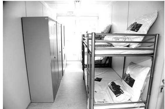
Рис. 1. Мобільне містечко для переселенців у м. Дніпродзержинськ.

зручностями та кімнати, що обслуговуються загальною кухнею, санвузлами та душовими); адміністративні (приміщення коменданту містечка, бухгалтерії, тощо) та обслуговуючі (пральні, дизель-генераторні, і т. ін.).