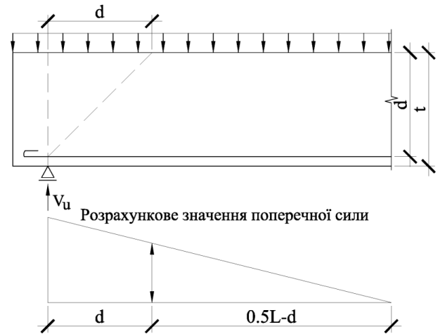
Рис. 2. Визначення розрахункової поперечної сили за методикою [4].