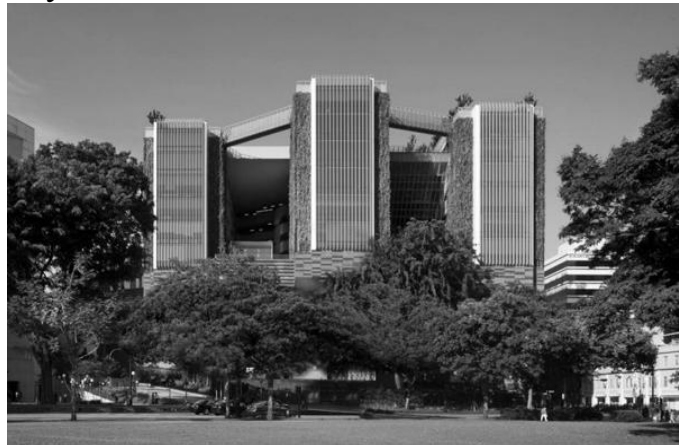
Рис. 3. Школа мистецтв в Сінгапурі, 2009, арх. група WONA

Висновок. Проаналізувавши історію виникнення закладів позашкільної освіти, можна сказати, що протягом свого розвитку їх архітектурна форма, оформлення внутрішнього простору, мета, яку ставили перед собою заклади, постійно змінювались. Історію цих установ можна поділити на три періоди: