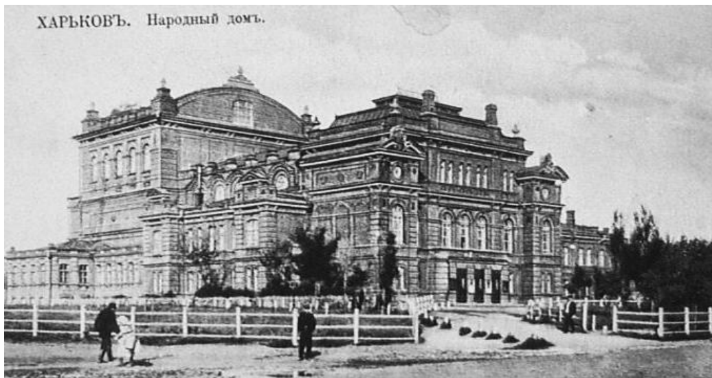
Рис.1. Народний Дім, Харків, поч. XX ст., арх. А. А. Венсан

Вважається, що вперше позашкільна форма роботи з дітьми з'явилася в 30-ті роки XVIII століття, коли в Шляхетському кадетському корпусі в Санкт-Петербурзі був відкритий гурток з літератури для занять у вільний час. Наприкінці XIX ст. стали відкриватися перші дитячі клуби в народних домах (рис. 1). В дореволюційній Росії народні дома були загальнодоступними культурно-просвітницькими закладами, в яких дорослі отримували вечірню освіту, а діти – позашкільну освіту. Дитячі клуби нагадували багато в чому сучасні гуртки для дітей. На початку XX ст. також стали з'являтися перші позашкільні заклади, які займалися вихованням: діти відвідували музеї, концерти, театри та інші культурні заклади. Нерідко для дітей організовували спеціальні курси з малювання, літератури та інших предметів.