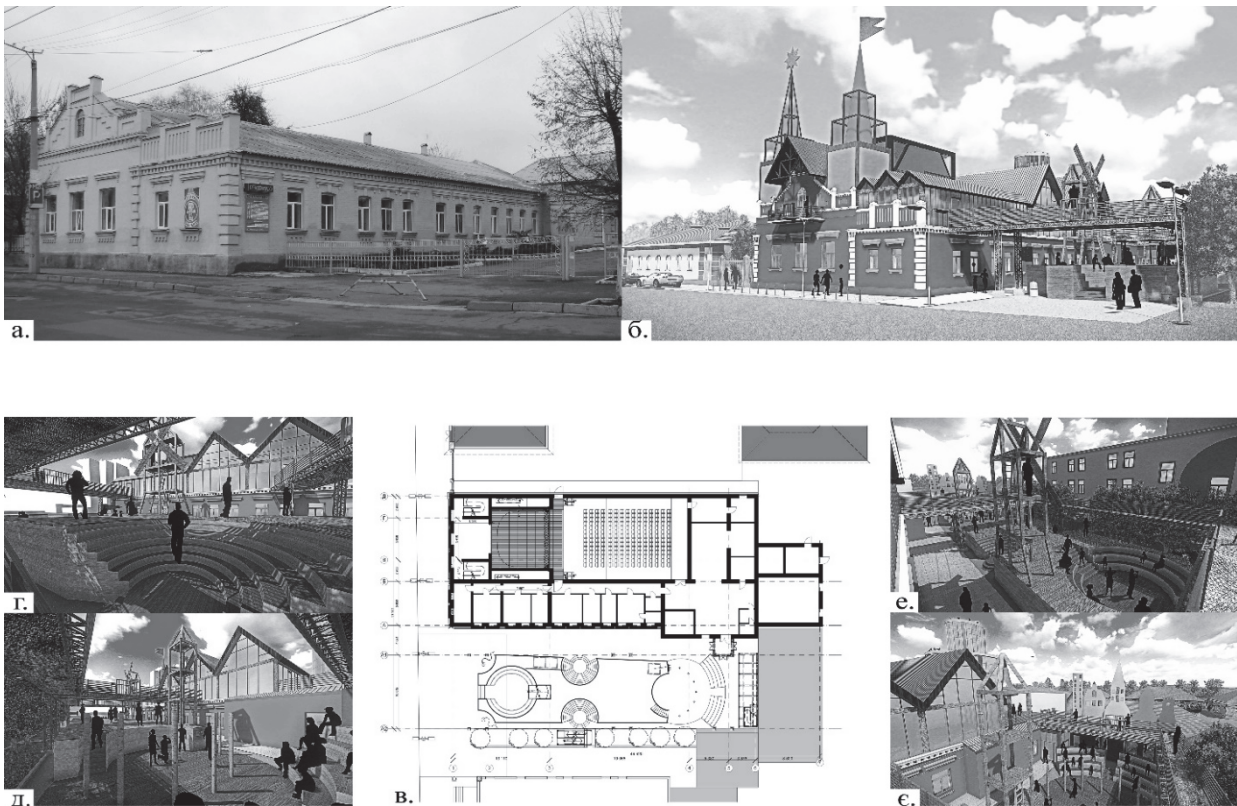
Рис. 1. Проект вирішення архітектури Лялькового театру у м. Кропивницький. а. Існуючий вигляд театру; б. Об'ємне вирішення з проспекту Винниченка; в. Відкритий план театру; г., д., е., є. Пропозиція вирішення подвір'я театру.

Головними ідеями рішення архітектури в цьому проекті були наступні: Ляльковий театр автори проекту запроектували в образ казкового замку, який є найпомітнішим в сформованому міському середовищі проспекту Винниченка. Металеві конструкції над вежами є декорацією та конструкцією