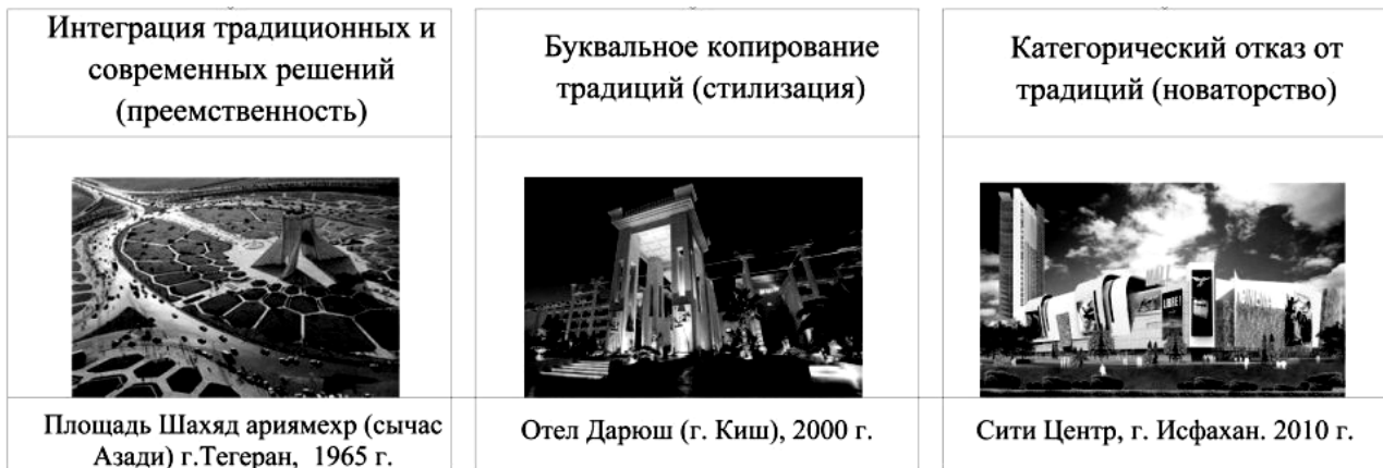
Рис. 4. Виды обращения к традициям в современной архитектуре Ирана

Опираясь на результаты критического анализа предшествующего опыта и передовые достижения архитектурной науки, сформулированы принципы преемственного развития многофункциональных комплексов Ирана. Принцип учета природно-климатических условий района строительства предполагает в каждом конкретном случае возведения многофункционального комплекса достижение полного соответствия между способами формирования архитектурной среды и особенностями соответствующей климатической зоны. Принцип совершенствования форм организации общественной жизни выдвигает требование обеспечения оптимального для Ирана сочетания жилой, общественной, производственной и рекреационной архитектурной среды в структуре многофункциональных комплексов. Принцип выражения духовных ценностей общества призывает к использованию в архитектуре многофункциональных комплексов достижений традиционной и современной мысли лучших представителей иранского народа, накопленных в сферах искусства, религии, философии и науки. Каждый из описанных принципов по-своему регламентирует организацию архитектурной среды многофункциональных комплексов на функционально-планировочном, объемно-пространственном и предметно-пространственном уровнях.