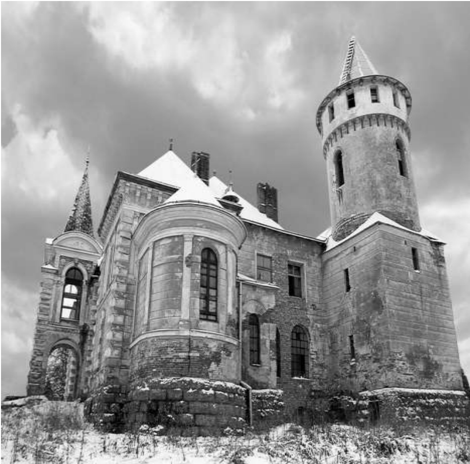
Рис. 1. Палац-садиба Рея XVIII–XIX ст. у с. Приозерне, Івано-Франківської області. Існуючий стан.