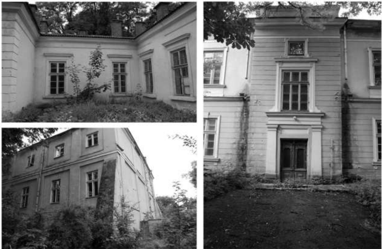
Рис. 3. Споруди палацу Потоцьких XVII — XVIII ст. у місті Івано-Франківську. Існуючий стан.

На сьогоднішній день колишній палац складається із ряду споруд XVII – XVIII ст., які разом із територією колишнього партеру створюють єдину композицію (Схема 1, а). Технічний стан кожної з них вимагає проведення ремонтно-реставраційних робіт (Рис. 3). Територія комплексу обнесена триметровою мурованою стіною. Вхід на територію палацу – через муровану браму, яка поєднана із двома флігелями. Минулого року було проведено реставраційні роботи на в'їзній брамі, що врятувало її від руйнації.