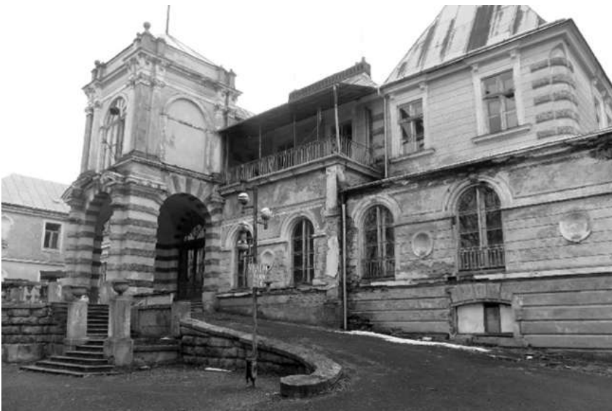
Рис. 2. Палац Жевуських-Лянцкоронських XVIII—XIX ст. у смт. Розділ, Львівської області. Існуючий стан.