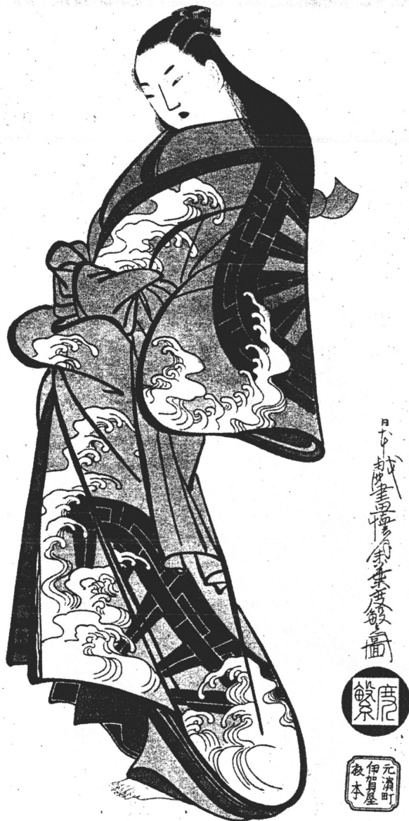
Рис. 3. Кайгецудо. Куртизанка. 1716 г.