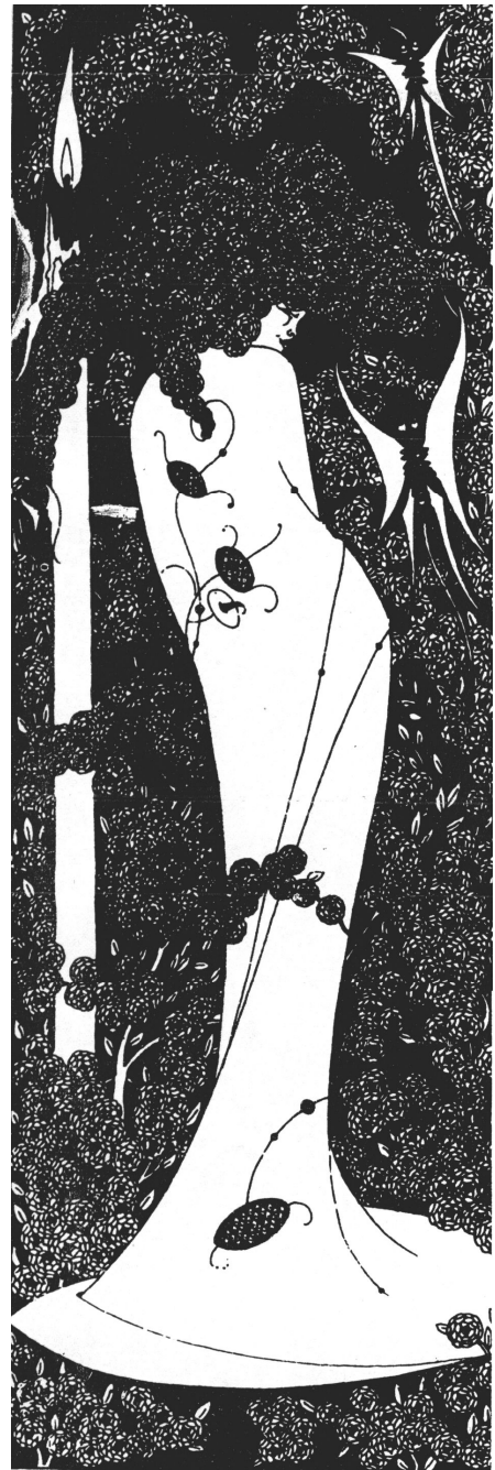
Рис. 4. Обрі Бердслей. Гравюра (фрагмент)

Ще одна особливість японської гравюри полягає в відсутності світлотіні, оскільки, на відміну від європейського мистецтва, японське мистецтво не ставить собі за мету передати ті зміни, які відбуваються з предметом під впливом зовнішніх факторів.