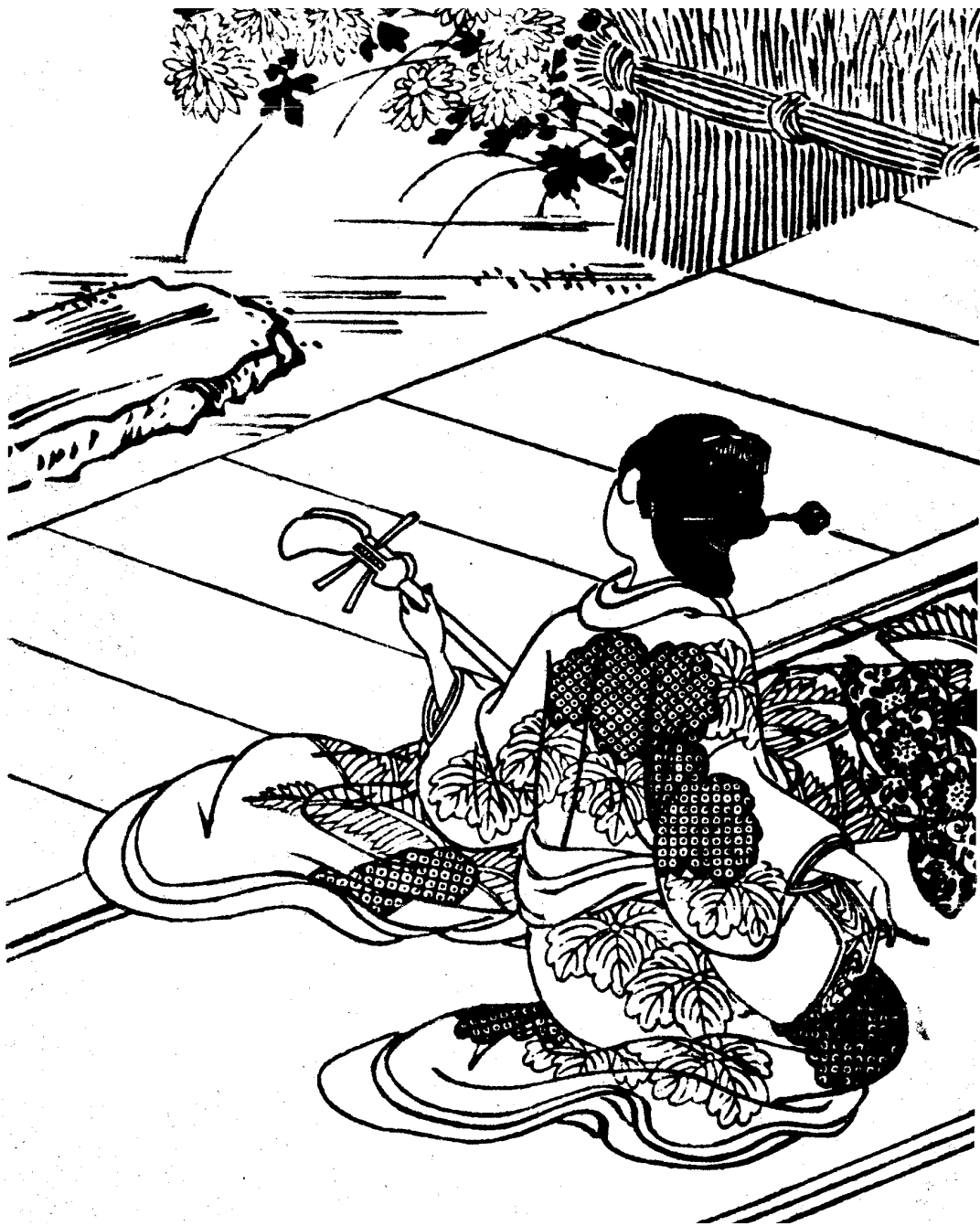
Рис. 1. Суkenoбу. Дівчина з сямисеном. 1730

виникає і зло. Тому буття і небуття породжують одне одного, важке і легке створюють одне одного, довге і коротке взаємно співвідносяться, високе і низьке взаємно визначаються, звуки, зливаючись, приходять у гармонію, попереднє і наступнє слідуєть одне за одним". Згідно цієї прийнятої теорії всі явища життя пояснюються тут природним чергуванням світла і темряви, тепла і холоду, зміною пір року, перетворенням першоелементів, існуючих за законом дао. Відповідно до філософської теорії "Даодецзину", людина є невід'ємною частиною приводних ритмів і тому живе за законами природи (рис. 1).