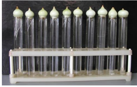
Рис. 3 – Біотест на Allium cepa

На цьому експеримент може бути завершений. Однак, з метою вивчення можливої оборотності впливу, виконання дослідження продовжували: через 72 години вимінювались досліджувані рідини в 2 дослідних пробірках у ряді з 5 і заповнювались інші 3 пробірки водою контролю. Через додаткові 24 години спостерігалось поліпшення росту корінців у 3 заповнених водою дослідних пробірках у порівнянні з 2 випробуваними зразками. Це означає, що ці корінці відновилися і в такий спосіб вплив більш-менш оборотний. Це може мати місце для всіх, декількох чи жодної з концентрацій у ряді.