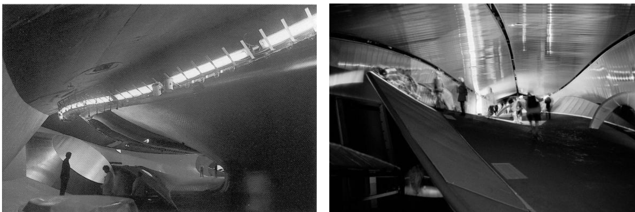
Рис. 1. Павільйони Прісної та Солоної води м. Зееланд, Голландія, архітектурне бюро NOX, 1994-97 рр.

Павільйон Солоної води, частково розміщений на воді і на суші, представляє собою зооморфний панцир, у середині якого знаходиться «гідра» – складна скульптурна форма. Інтер'єр споруди постійно змінюється: реальний простір доповнюється проекціями віртуального тривимірного світу на внутрішню поверхню павільйону. Відвідувачі можуть керувати цими проекціями та взаємодіяти з ними рухаючись у середині ілюзорного простору. Споруда має власну метеостанцію і переводить її данні про стан погоди у музичні та світлові імпульси, які трансформують внутрішнє середовище.