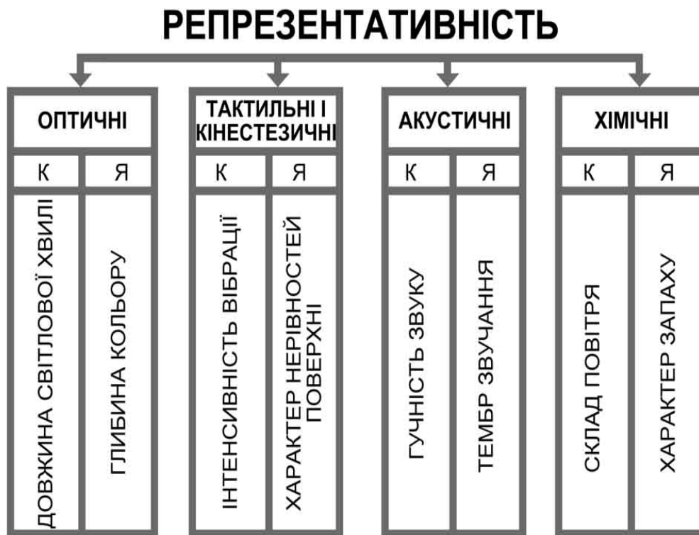
Рис. 4. Показники репрезентативності архітектурного середовища

Безперечно, система показників гармонічності архітектурного середовища, критерієм досконалості якого виступає репрезентативність, потребує спеціального ґрунтовного дослідження. Разом з тим, очевидно, що відчуття гармонії при чуттєвому сприйнятті «інтерактивного» архітектурного середовища досягається за умови узгодження між собою всієї сукупності згаданих показників. Так оточення, наведене на рис. 1, 2, 3, збуджує уяву і змінює настрій людини через одночасну дію на її зорову, кінестезичну та слухову сенсорні системи.