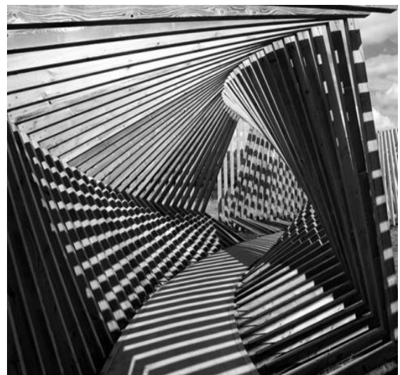
Рис. 3. Архітектурно-звукова інсталяція ЕККО, Данія, художник Т. Франк, 2012 р. Зовнішній вигляд. Інтер'єр.