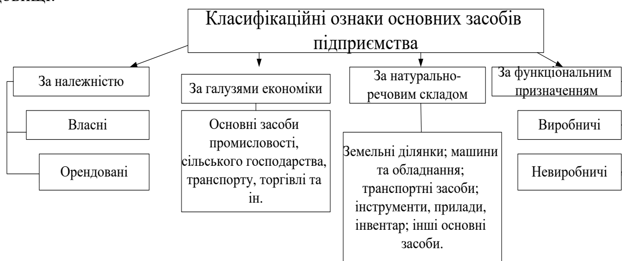
Рис. 2. Класифікація основних засобів підприємства

Раціональне управління та контроль за основними засобами дозволяє підприємству мінімізувати витрати, забезпечувати стабільність виробничих процесів та підвищувати конкурентоспроможність у динамічному ринковому середовищі.