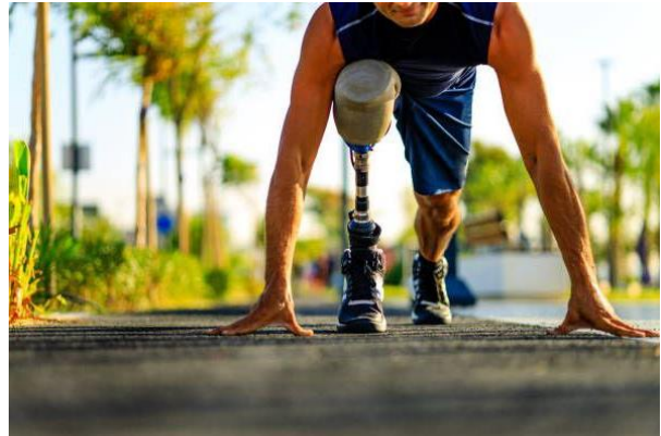
Рисунок.2 Використання протезів

мета в медицині – відновлення або заміщення втрачених функцій у пацієнтів із тяжкими порушеннями. Сучасні протези з елементами штучного інтелекту можуть адаптуватися до користувача, підвищуючи точність і комфорт, що значно покращує якість життя.