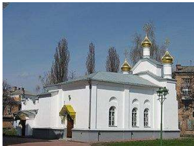
Рисунок 1 . Микільська Церква

В історичних джерелах зазначено, що храм був центром не лише духовного життя, а й місцем громадських зборів. Біля церкви регулярно збиралися козацькі ради, на яких обговорювалися місцеві справи, вирішувалися юридичні спори та планувалися оборонні заходи. Таким чином, храм виконував функцію і релігійного, і соціального центру.