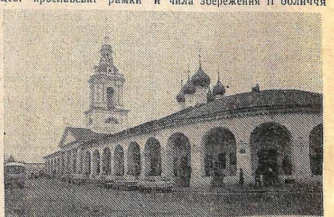
Красні торгові ряди в Костромі.

Мистецтво й архітектура Ярославля кінця XVII століття внесли величезний вклад в історію російської культури. Так склалися північноросійська архітектурно-мистецька школа, що далеко переросла вузькі місцеві ярославські рамки й