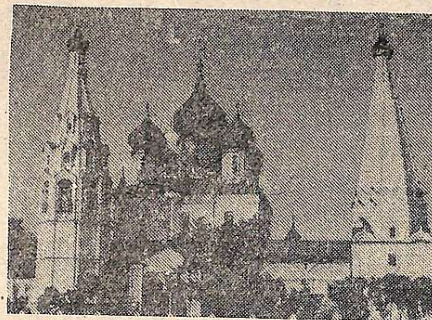
Церква Іллі Пророка в Ярославлі.

Капітальна забудова Костроми у XVIII—першій половині XIX століття забезпечила збереження її обличчя