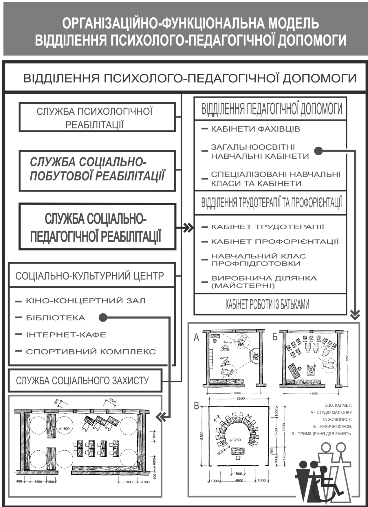
Рис.1. Організаційно-функціональна модель відділення психолого-педагогічної допомоги.