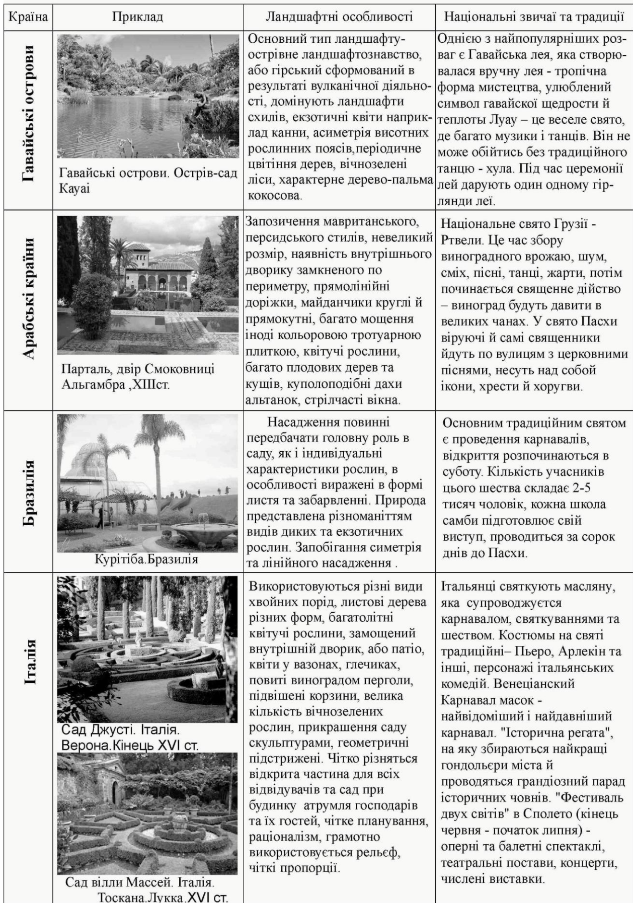
Таблиця 2 Етнічні та ландшафтні особливості рекреаційно-розважальних парків