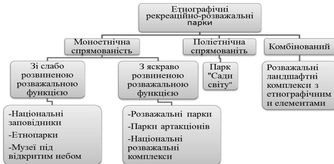
Рис.1 Класифікація етнічних рекреаційно-розважальних парків

Друга течія – поліетнічної спрямованості представляє так звані "сади світу" – це рекреаційно-розважальні парки, що включають в себе мікроландшафти з різних національностей країн світу. Прикладами є парк "Сади світу" в Марцані (Німеччина), пекінський Парк Світу, парк "Апельтерн" Нідерланди, національний парк світу Галіполійського півострова (Туреччина), в Печерському Парку під Києвом планується розробити 15-20 мікроландшафтів з різних країн світу. На основі проведеного дослідження виведена класифікація етнічних рекреаційно-розважальних парків наведена на рис.1.