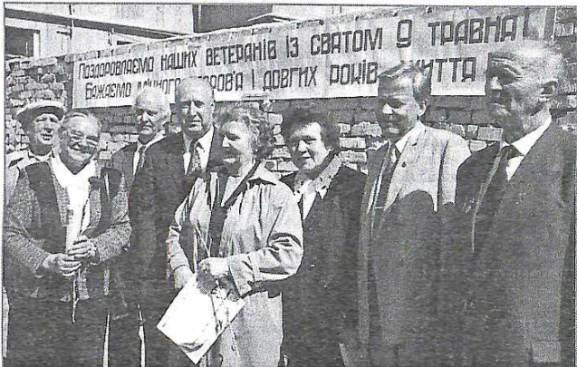
6 травня 2001 р. На святі ветеранів Великої Вітчизняної війни.