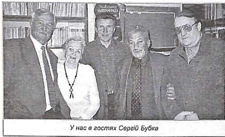
У нас в гостях Сергій Бубка

Деякі години, проведених в палаці спорту м. Донецька, мабуть, запам'ятаються на все життя. Не можна було втриматися від запрошення Сергія Назаровича Бубки відвідати міжнародні змагання, започатковані ним, — "Зірки жердини". Тим більше, зважаючи на плідні стосунки між Донецьким держуніверситетом і КНУБіА та витрати на відрядження, які взяв на себе господар.