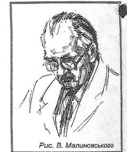
Рис. В. Малиновського