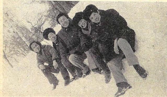
На снимке: Ряды первому снегу вьетнамские аспиранты и стажеры.