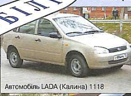
Автомобіль LADA (Калина) 1118