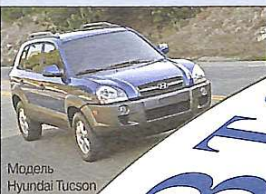
Модель Hyundai Tucson