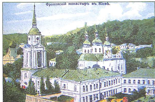
Свято-Вознесенський Фролівський монастир, 1910 рік.