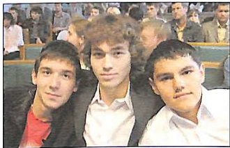
Нове пополнення ФАІТу