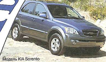
Модель KIA Sorento