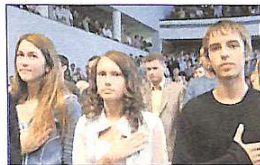
Звучить гімн університету