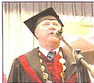
Щирі слова від ректора