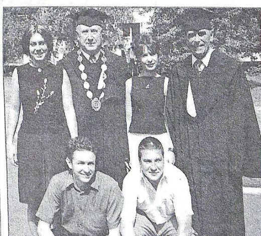
Фото на згадку