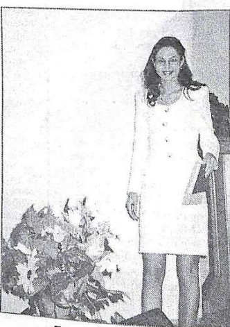
Дипломи вже в руках