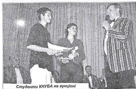
Студенти КНУБА на аукціоні

ники запропонували студентам, викладачам, співробітникам КНУБА стати першими глядачами цієї веселої, дотепної програми.