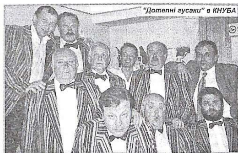
"Дотепні гусакі" в КНУБА

Наприкінці травня в актовому залі нашого університету проходила зйомка нової телепрограми клубу любителів анекдотів "Золотий гусак". Артисти-учас-