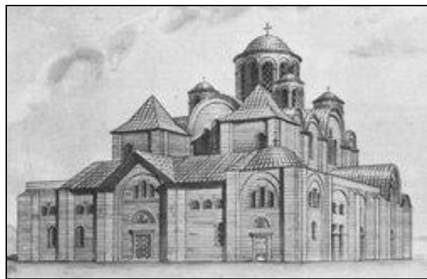
Рис. 4. Реконструкція Десятинної церкви за Ю.Асєвим

Лядські ворота (Печерські ворота) на Майдані Незалежності стали ще одним предметом для дискусій. У 2001 р. проведено реконструкцію Майдану та споруджено пам'ятник на честь 10-річчя незалежності України. В ході цієї реконструкції справжні рештки воріт було частково пошкоджено під час риття котловану для ТРК «Глобус», а потім законсервовано. На їхньому місці на поверхні було зведено ворота, які мають вигляд барокової «тріумфальної арки», а увінчує їх фігура Архангела Михаїла – небесного покровителя міста. Дискусійним виявився їх вигляд, який не ґрунтується ні на яких наукових реконструкціях.