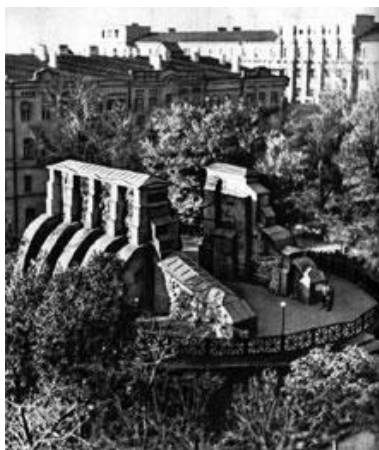
Рис. 1. Руїни Золотих воріт у Києві, фотографія 1970 р.