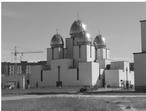
Рис. 5. Церква Різдва Пресвятої Богородиці на пр. Червоної Калини у Львові (арх. Р. Жук)

Червоної Калини (Р. Жук), рис. 5, церква св. мучеників Бориса і Гліба на перетині вул. Стрийської та Наукової (Р. Сивенький), церква Всіх святих українського народу на вул. Петлюри (Л. Скорик); у Києві: церква біля Південного терміналу головного залізничного вокзалу (Р.Сивенький), рис. 6, кафедральний собор Української греко-католицької церкви (М.Левчук); на Івано-Франківськійщині – церква у с.Тлумач (З.Соколовський, О.Мельник); у Харкові Свято-Сергіївський храм на вул. Дерев'янка (В. Можейко, Л. Черкашина), Студентська каплиця на вул. Лермонтовській (В. Можейко), храм Святого Священномученика Александра (А. Ткаченко, П. Чечельницький, Ю. Шкодовський, М. Кіреєв) та багато інших.