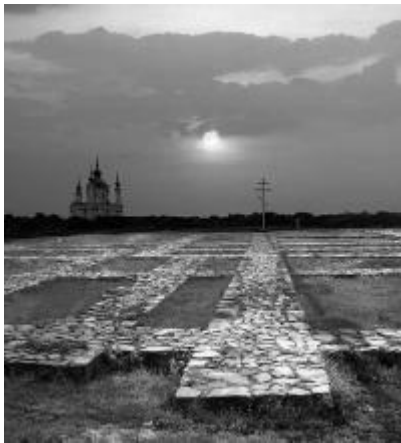
Рис. 3. Законсервовані фундаменти Десятинної церкви у Києві

1939 рр. М. Каргер та опублікував зведений план усіх розкопок пам'ятки. Спираючись на цей план, розробляли свої численні варіанти реконструкцій Десятинної церкви інші автори 2 , рис. 4. Нині існує півтора десятка (!) варіантів такої реконструкції і як виглядала церква невідомо: «На відміну від Михайлівського та Успенського соборів, а також церкви Успіння Богородиці (Пирогощі), відновлення яких велось при наявності необхідної документації (окрім того, їх було зруйновано за пам'яті нинішнього покоління), складний характер споруди Десятинної церкви, брак даних про висоту всіх частин храму викликали і продовжують викликати різні тлумачення й різні версії щодо її вигляду» [8]. Питання про доцільність відтворення цієї святині досі не вирішене.