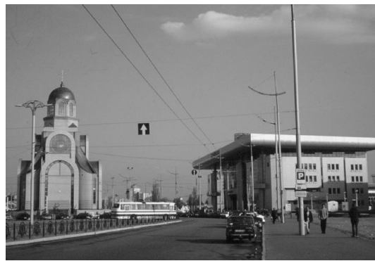
Рис. 6. Церква біля Південного терміналу головного залізничного вокзалу у Києві (арх. Р.Сивенький)