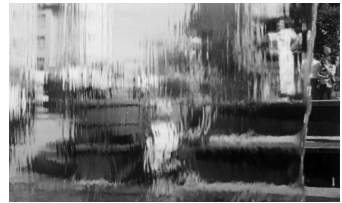
Рис.9. Погляд крізь водоспад.

Аналіз морфології забудови на основних шляхах в'їзду в місто[12] показує, що забудова тут часто ведеться без врахування їх ролі в структурі міста. Житлові багатоповерхівки в останні десятиліття змінили панорами вздовж річок і силует історичного центру. Для ділянок, які сприймаються з мостів через Бистрицю Солотвинську і Бистрицю Надвірнянську, моста через залізницю, важливою є виразна силуетна забудова. Проте при вирішенні верхніх поверхів рядової забудови і доміант часто не враховується даний аспект.