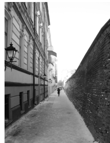
Рис.3. Фортечний провулок.

Середовище середмістя складається з ринкової площі з периметром забудови, приринкових кварталів, палацу Потоцьких, сакральних пам'яток, залишків оборонних фортифікацій, вулиць. У XVIII ст. силует міста «мав вигляд контрастної і водночас гармонійної композиції, що поєднувала в собі висотні домінанти у вигляді: веж сакральних споруд, ратуші та міських брам і