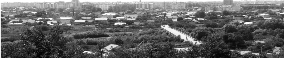
Рис.1. Панорама міста з Вовчинецького пагорбу.

типовими проектами масових серій з домінантами колишніх адмінбудівель промпідприємств, доповнилися новими житловими багатоповерхівками. На початку XXI століття силует районів доповнили завершення храмів.