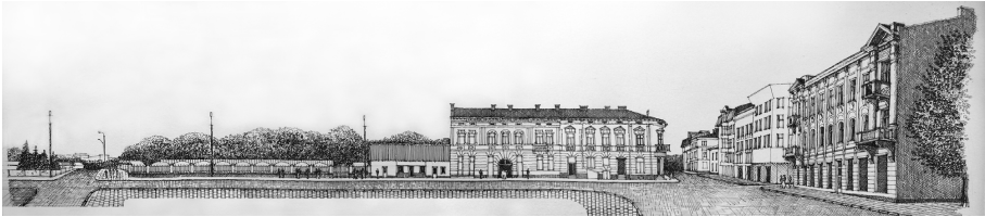
Рис.5. Розгортка по вул. Дністровській. Тут була Галицька брама (мал. автора).

старого ринку (рис.5). Силует міста з південно-східного заболотівського передмістя закритий сьогодні зведеним в радянський період адміністративним будинком.