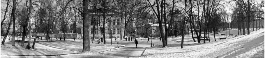
Рис.7. Міський краєвид з валів у сквері на Гетьманських валах.

(рис.7). Таким чином, хоч місто розташоване на рівнині, з підвищеної території колишніх оборонних фортифікацій – бастіону і валів – є можливість огляду міських краєвидів.