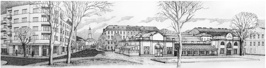
Рис.4. Вид на середмістя з південного заходу. Тут була Тисменицька брама (мал. автора).

Оскільки після ліквідації фортифікацій Станиславова на їх місці не було створено кільцеву рекреаційну зону, як у інших містах тогочасної Австрії, а з укріплень частково зберігся тільки один бастион, сьогодні уяву про межі середмістя дають вали, бастион і забудова на місці колишніх фортифікацій.