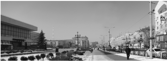
Рис.8. Панорама центру.

Силует центру при в'їзді зі сходу творять забудова та зелені насадження нового центру міста, який виник в першій половині ХІХст. після демонтажу фортечних укріплень. В пострадянський період завдяки вставкам ліквідовані прогалини в рядовій забудові, і силует міста збагатився вирішенням верхніх та мансардних поверхів (рис.8). Оновилися центральні площі, які приваблюють сьогодні жителів міста; кожна з них має відповідну функцію. Вічевий майдан доповнився новим фонтаном, з якого на місто можна глянути крізь водоспад. Вирішення об'єкту додало нових емоцій у сприйняття історичного середовища (рис.9).