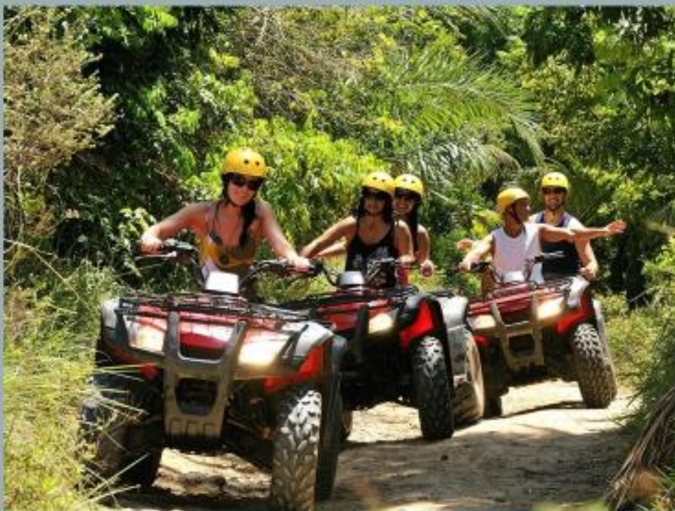
Сафарі на квадроциклах