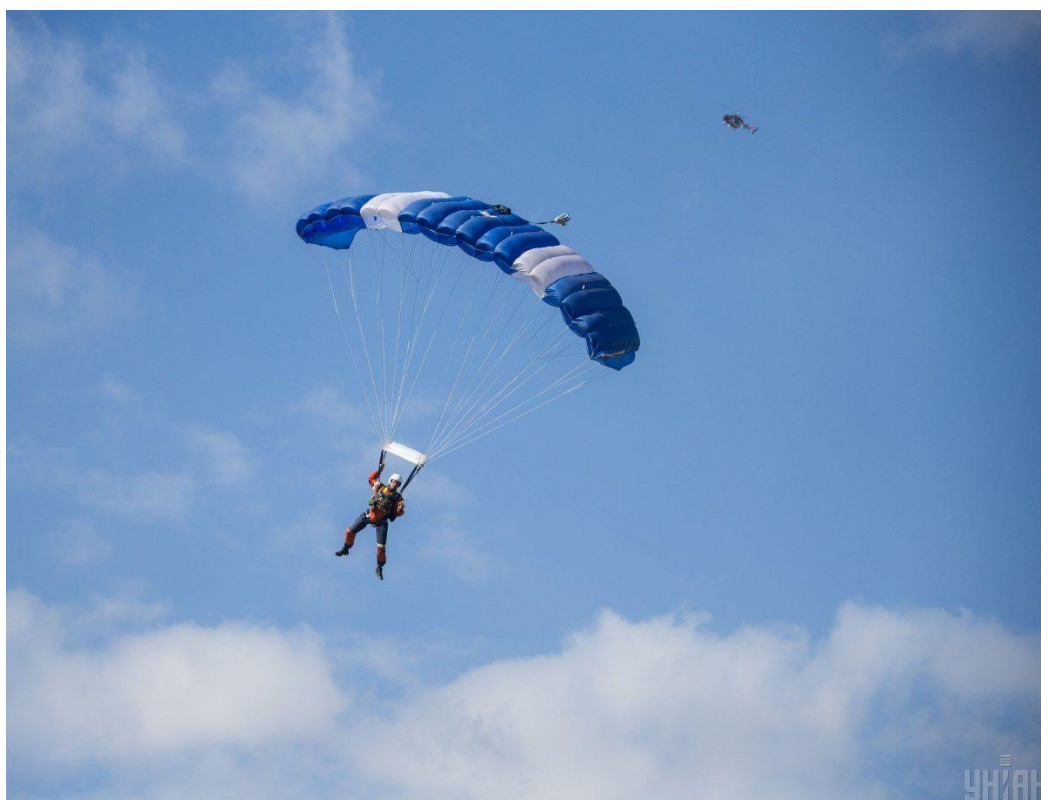
Рис.3.1. Стрибки з парашутом

Заняття парасейлінгом - це захоплюючий вид розваги, при якому окремі люди або групи до 3 осіб піднімаються над поверхнею води за допомогою унікального парашута, прикріпленого до човна за допомогою троса.