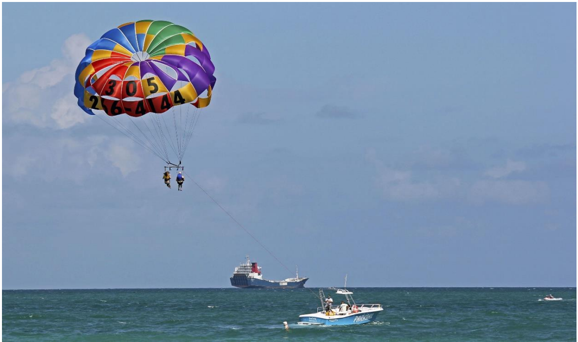
Рис.3.2. Заняття парасейлінгом

Паратрайк - це надлегкий літальний апарат, в якому для польоту використовується парашутне крило і двигун пропелерний. Робота двигуна здійснюється спільно з керуванням крилом за допомогою строп. Що відрізняє паратрайк від аналогічних пристроїв, то це його здатність розмістити як пілота, так і пасажира. При максимальній висоті 5 км паратрайк може розвивати швидкість 55-60 км/год, а відстань, яку може подолати під час польоту, визначається кількістю палива у його баку(рис.3.3.).