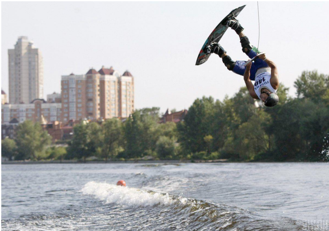
Рис.3.4. Заняття вейкбордингом

FlyBoard , незвичайний та новаторський екстремальний вид спорту. FlyBoard піднімає людей над поверхнею води, використовуючи компактну платформу, оснащену спеціально розробленими черевиками з водяними форсунками під високим тиском. Випробуйте гострі відчуття, кидаючи виклик гравітації і ковзаючи повітрям за допомогою цього інноваційного водного спорту.