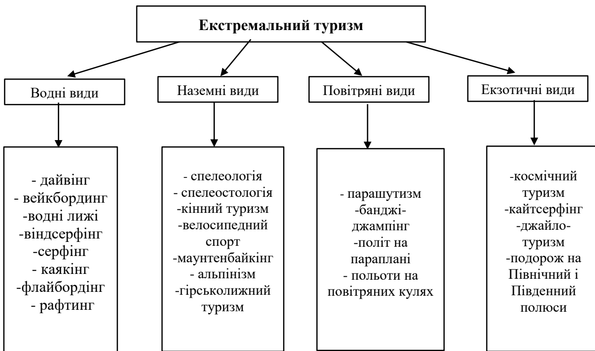
Рис.1.1. Види екстремального туризму

Сфера екстремального туризму є перспективним напрямком для розвитку сучасного дозвілля. У перші роки ХХІ століття значна кількість людей, особливо тих, хто проживає у високорозвинених країнах із розвинутою економікою, прагнуть яскравих емоцій. Процес урбанізації та прогрес індустріалізації призвели до майже повного відриву людства від світу природи. Хоча любителі полоскотати нерви вже дослідили майже кожен дюйм поверхні Землі, все ще існують загадкові куточки природи, які пропонують гострі відчуття та романтичну чарівність, спонукаючи людей вирушити у незвідане.