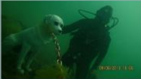
Одеський підводний музей