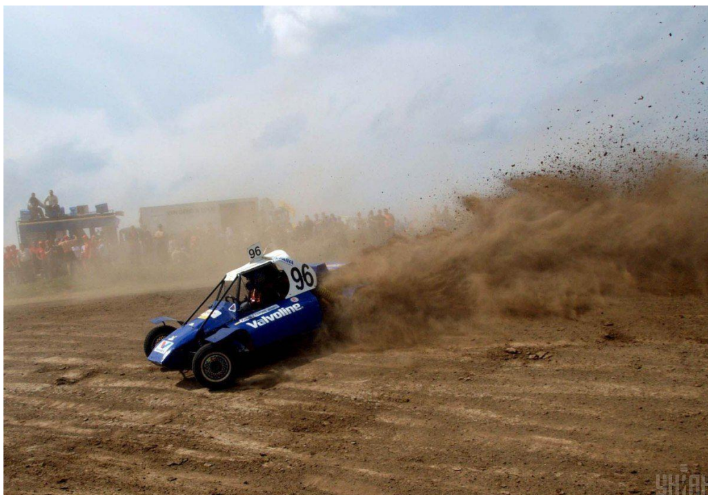
Рис.3.6. Катання на багі

Знаменитий танк Т-34 подарує незабутні враження. Авторитетні фахівці та військові експерти називають його одним із найкращих танків часів Другої світової війни. Вирушайте в захоплюючу подорож мальовничою лісистю місцевістю під керівництвом досвідченого військового, який продемонструє тонкощі управління цією грізною бойовою машиною та надасть необхідні інструкції з техніки безпеки під час вашої подорожі в її межах(рис.3.7).