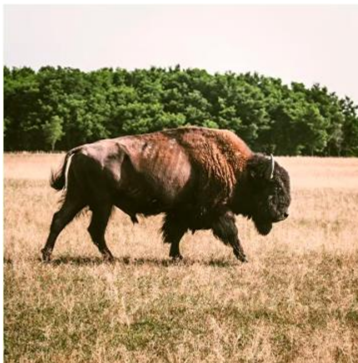
Рис.3.9. Знімок зубра з сафарі-парку «Медвино» [22]

Для тих, хто хоче провести довгий вечір, можна орендувати альтанку на березі річки з приладдям для барбекю. Вартість оренди альтанки із мангалом на цілий день складає 500 гривень. Як варіант, лісову альтанку можна орендувати погодинно, за ціною 100 гривень за годину.