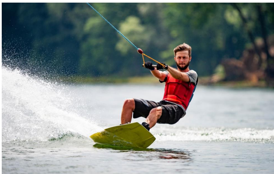
Рис.1.2. Заняття вейкбордингом

Вейкбординг - це захоплюючий водний вид спорту, що поєднує в собі елементи сноуборду, водних лиж, скейтбордингу та серфінгу. У цьому занятті людину буксирують за човном, використовуючи компактну та широку платформу, на якій можна стояти(рис.1.2.). Додаючи судну додаткову вагу, воно створює бриж на воді, яка служить стартовим майданчиком.