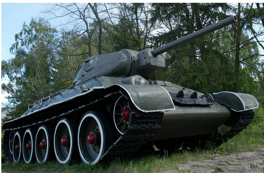
Рис.3.7. Знімок танку Т-34

https://www.facebook.com/thetank34/ [21]