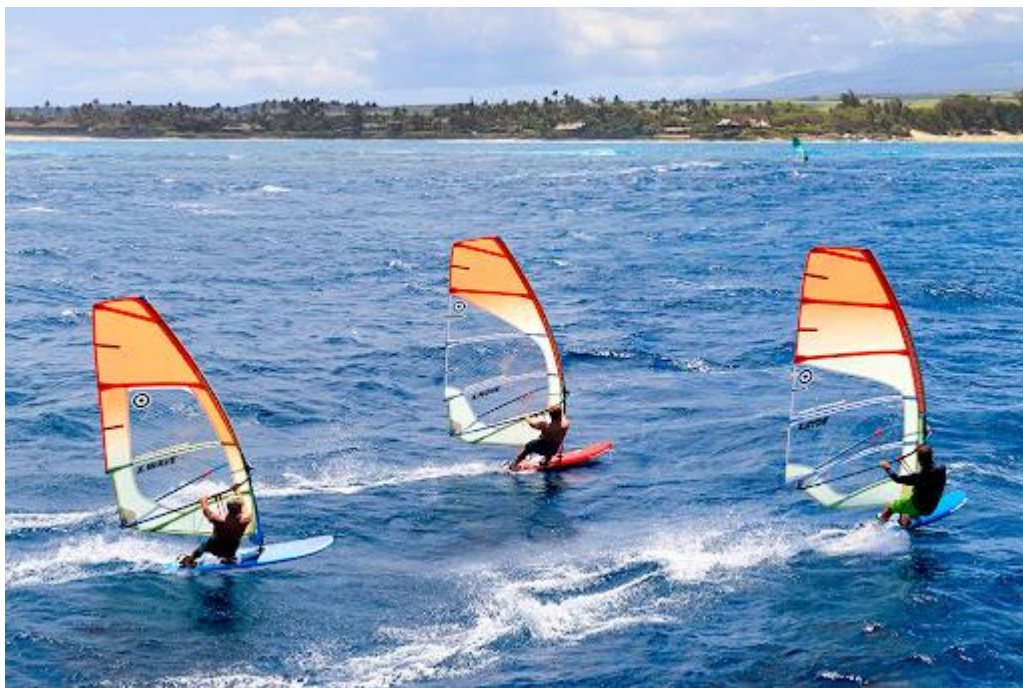
Рис.1.3. Заняття віндсерфінгом

коли вони витончено наближаються до берега, отримуючи задоволення від ковзання на гребені хвилі.