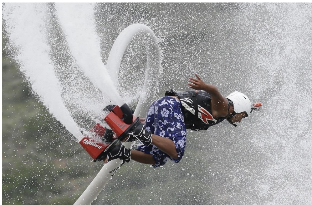
Рис.3.5. Заняття флайбордингом

Вирушаючи в пригоду на багі , ви отримаєте вражаючий досвід. Ці відкриті та легкі автомобілі спеціально створені для їзди бездоріжжям, що дозволяє вам з легкістю переміщатися пересіченою місцевістю. Завдяки гоночній системі багі дозволяє швидко набирати швидкість, зберігаючи при цьому високу маневреність. Хоча встановлено вікове обмеження, але до веселоців можуть приєднатися діти у супроводі батьків, від 9 років.