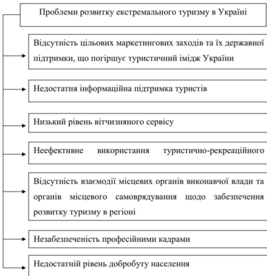
Рис.2.1. Проблеми розвитку екстремального туризму в Україні