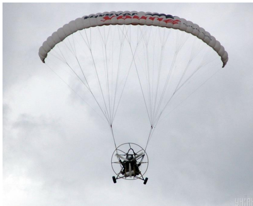
Рис.3.3. Заняття паратрайком

Вейкбординг - це універсальний вид спорту, що поєднує в собі елементи серфінгу, сноуборду, скейтбордингу та водних лиж. Гонщик стоїть на широкій та компактній дошці, яку буксирує човен. Коли човен досягає швидкості 30-40 км/год і несе додаткову вагу, за нею створюється слід, який є стартовим