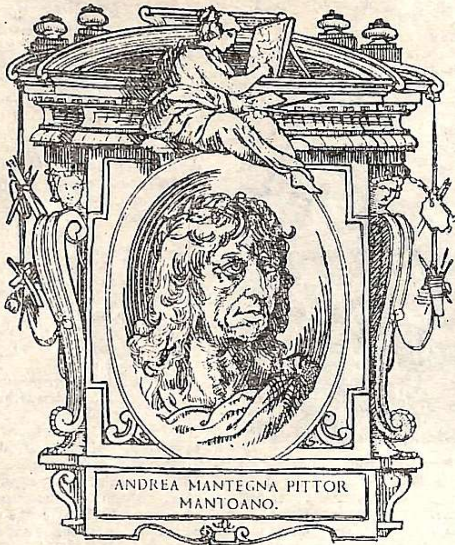
ANDREA MANTEGNA PITTOR MANTOANO.

Відомо, що для «Словника сучасної художньої термінології» (1925—1928 рр.) який готувався Державною Академією художніх наук, О. Г. Габричевським (1891—1968) було створено статтю «Гротеск». Словник, у підготовці якого брали участь такі видатні вчені, як Г. Г. Шпет, О. Ф. Лосев, М. О. Петровський та ін., так і не був виданий.