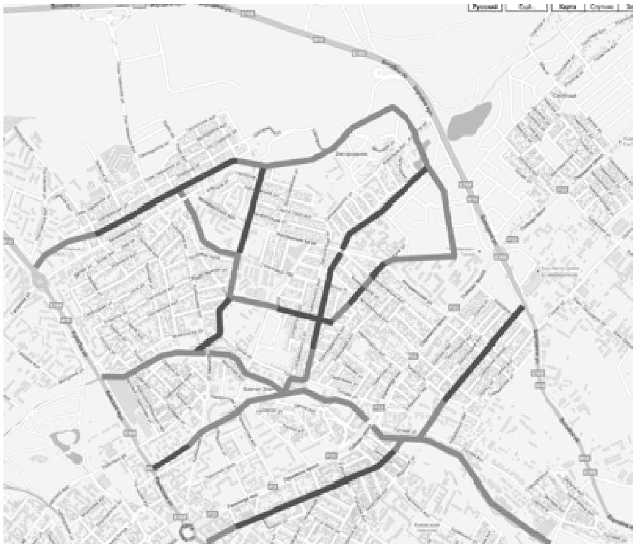
Рис. 2. Возможность формирования каркаса пешеходных улиц в северо-восточной части города Симферополя. Более темным цветом показано использование существующих жилых улиц в качестве пешеходных зон.

застройке, а также фактор частной собственности, способный осложнить прокладку новых пешеходных улиц в ткани селитебной территории. Одним из способов формирования каркаса пешеходных связей в такой ситуации является использование существующих жилых улиц и придание им функции пешеходных зон (знак 5.33 по ПДД), как показано на рис. 2.