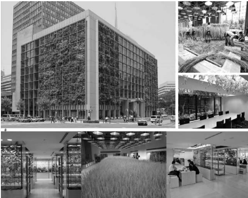
Рис.3 Офіс Pasona в Токіо. Екстер'єр, інтер'єр

рішень – площі забудови, суміжності функцій, варіанту підключення інженерних систем, у випадку кооперування з житловою функцією – врахування рівню комфортності житла за поверховістю (для житла постійного перебування рекомендовано не перебільшувати 8-12 поверхів, для тимчасового житла – поверховість не обмежена) [3]. Суміжно-прибудовані комплекси мають ряд переваг, так як легше підвести комунікації до виробничого блоку та забезпечити автономність інженерних систем. До рослинницьких агрокомплексів, вбудованих в нижню частину будівлі легше підвести комунікації, але важче забезпечити доступ до суспільної зони, і, навпаки, до рослинницьких ферм, прибудованих до верхньої частини будівлі важче підвести комунікації, але легше організувати суспільну зону. Розміщення зон теплиць може відбуватися розосереджено по різних частинах будівлі та виконувати рекреаційну функцію (наприклад, як в офісі Pasona в Токіо) (рис.3) [4].