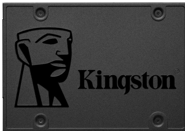
Рисунок 5. Зовнішні накопичувачі

7.2 SSD (твердотільні накопичувачі) - накопичувачі використовують флеш-пам'ять для зберігання даних. Вони швидші, легші та більш стійкі до механічних пошкоджень, але зазвичай дорожчі.