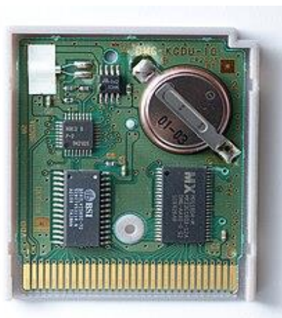
Рисунок 2. Постійна пам'ять (ROM)

4.2 Тільки для читання - дані записуються один раз під час виробництва або програмування і не можуть бути змінені під час звичайної роботи пристрою.