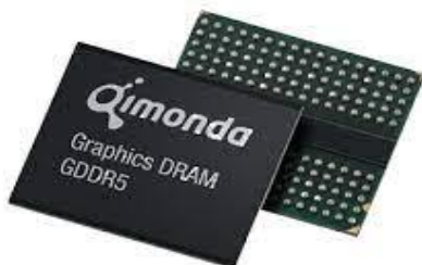
Рисунок 4. Відеопам'ять

6.3 Типи - існують різні типи відеопам'яті, такі як GDDR5, GDDR6, HBM, які відрізняються за швидкістю та енергоефективністю.