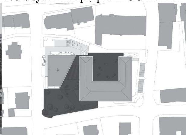
Рис. 3. Старша школа « High School Crinkled Wall » в Куфштайні (Австрія), арх. Wiesflecker Architecture

Проаналізувавши структури будівель, можна виділити такі групи просторів, що диференціюються за функцією та розміщенням у структурі будівлі: