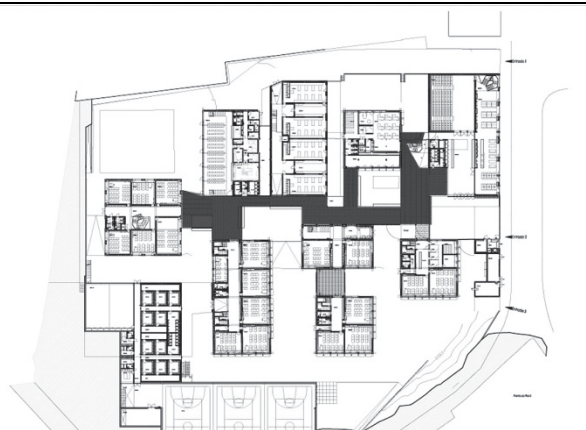
Рис. 1. Проект школи « Santa Maria High School » у Португалії, арх. Appleton Domingos Arquitectos