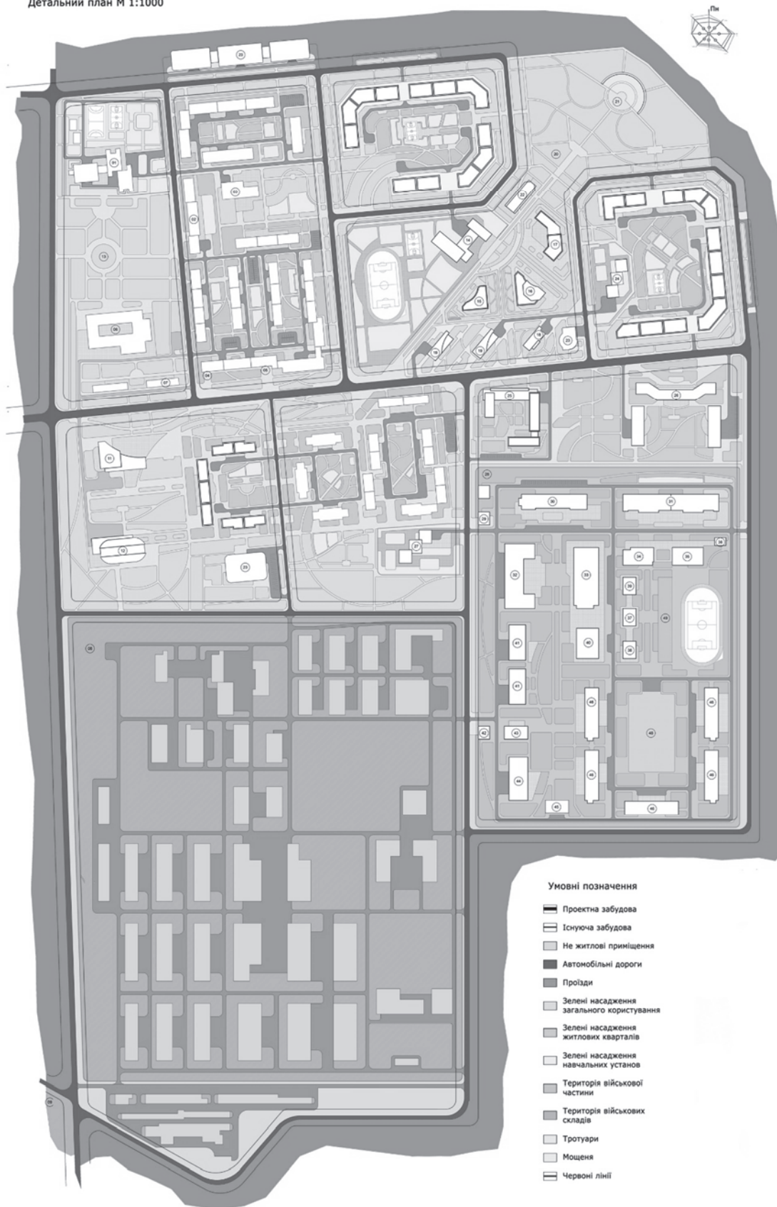
Рис. 1 Детальний план військового містечка відкритого типу в м. Чугуїв