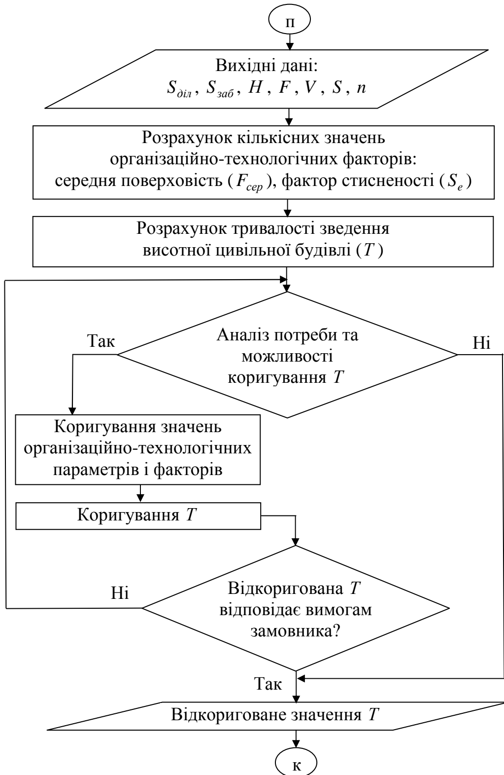
Рис. 4. Блок-схема обґрунтування тривалості зведення висотних цивільних будівель в умовах ущільненої міської забудови