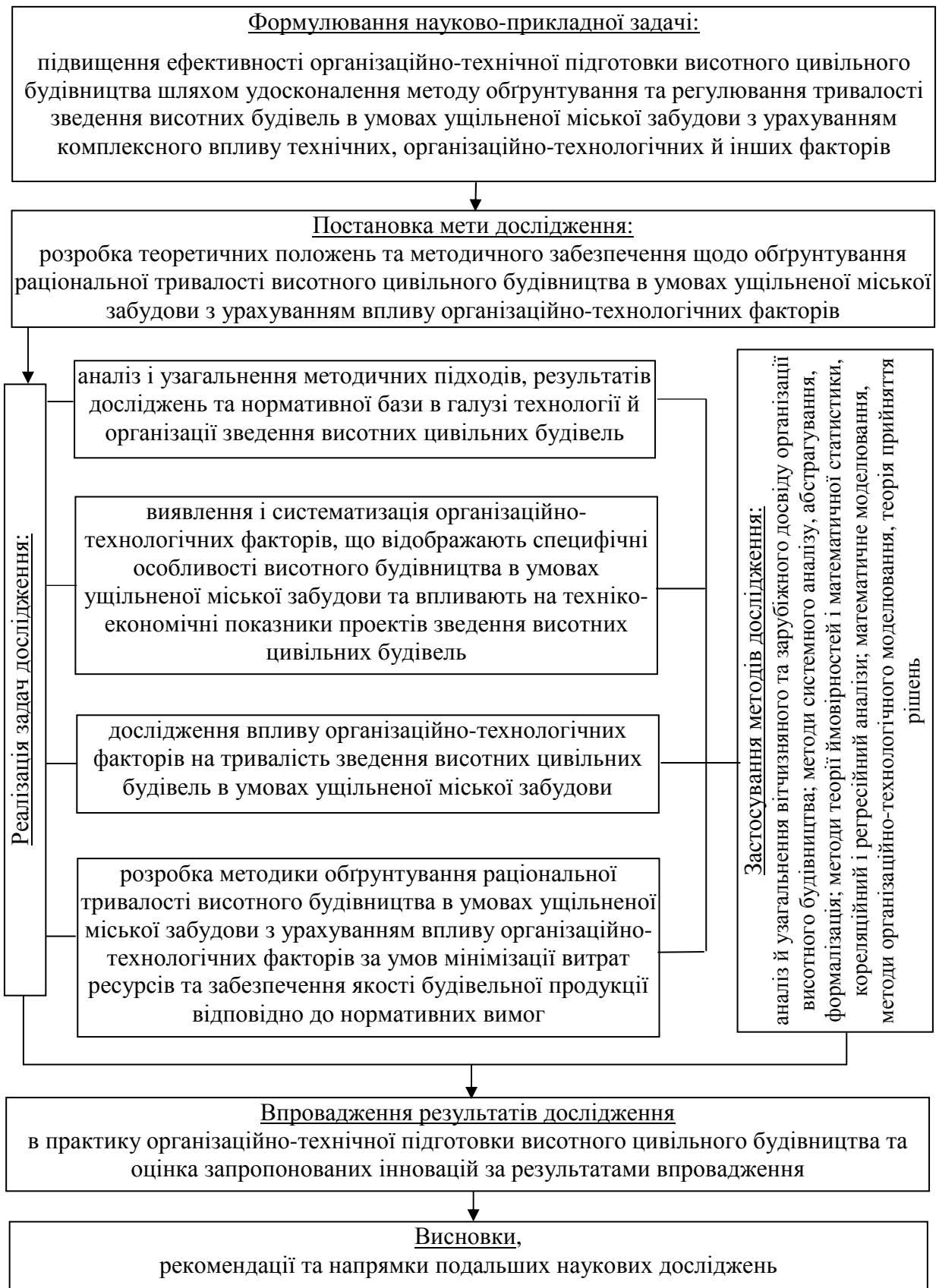
Рис. 1. Структурно-логічна схема дослідження