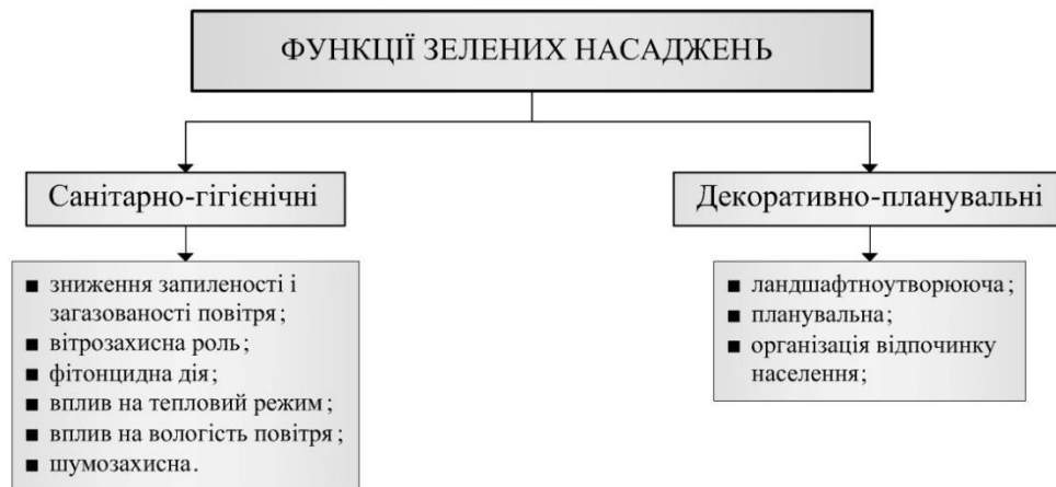
Рис. 2 Функції зелених насаджень

фотосинтезу поглинають вуглекислий газ і виділяють кисень. В середньому 1 га зелених насаджень поглинає за 1 год. 8 л вуглекислоти (тобто, стільки, скільки вуглекислоти виділяють за цей час 200 чоловік) [1].