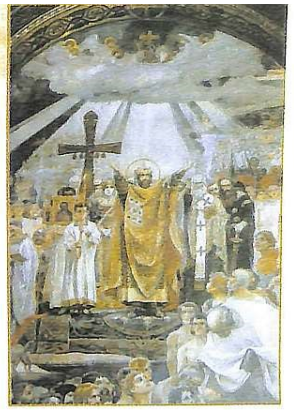
В. Васнецов. Князь Володимир хрестить народ

під магістратським прапором – золотом короговою. Поки здійснювалася святкова літургія в церкві Успення Пресвятої Богородиці на Подолі, навколо храму шикувалися міські гвардії і кіннота в святкових мундирах. А далі на вул. Флорівській – піхота. Вона складалася з 15 цехів, кожний з яких мав свою коргову – величезний прапор із зображенням святого покровителя. Після закінчення церковної служби духовництво з хрестами і короговами йшло до фонтану Самсона, що в центрі Подолу, щоб освятити в нім воду. Коли починали співати "многая літа" в повітря запускали ракету. Це був сигнал до того, що пора всім включатися в масове святкування. Тоді починали дзвонити дзвони, гриміти музика, а навколо Гостиного двору марширували війська. Коли підходив час святкової салюту – стріляли з лістолетів, а потім – і з гармат. Цікаво, що кожен учасник параду цього дня мав право стріляти в повітря скільки йому завгодно. При цьому ніяких інцидентів, пов'язаних із застосуванням зброї, не відбувалося. Після закінчення параду киїни відправлялися святкувати далі: високоставлені міські мужі і вище духовництво – у Верхню залу Конотрахового будинку, а рядові учасники церемонії – в управі своїх ремісничих цехів. Крім того, до цього моменту на одному з живописних узгір'їв Києва, яке богомільно звали Палестинною, встановлювалися намети для подальшого банкету середгородян. Це галасливе масове свято можна по праву назвати прообразом Дня Києва.