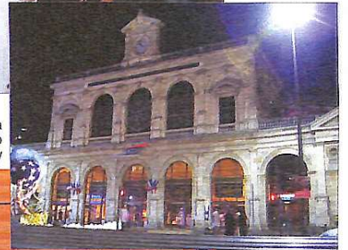
Споруда північного вокзалу