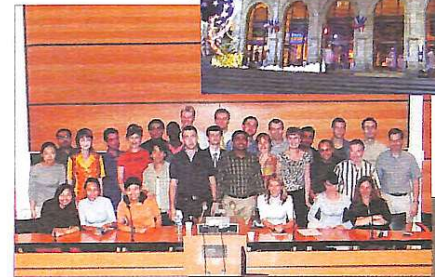
Члени міжнародного осередку молодих проєктних менеджерів.