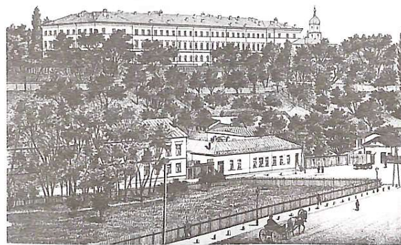
ІНСТИТУТ БЛАГОРОДНИХ ДІВЧАТ

Історія цього будинку, колишнього Жовтневого палацу культури сходить до першої половини XIX століття. Почалося все з того, що відставний генерал Дмитро Бегичев, який володів обширною ділянкою на схилі височини над Хрещатиком, в липні 1834 року повідомив генерал-губернатору Василю Левашову, що готовий цю нерухомість "подарувати на користь відкритого нині в Києві Університету князя Володимира або ж на інший такий загальнокорисний предмет без всякої за те мені оплати або іншої винагороди". Дар був прийнятий з вдячністю. Якийсь час в будинку Бегичева університет зберігав свою бібліотеку, але незабаром за ініціативою Левашова садубу відвели під майбутній Інститут шляхетних