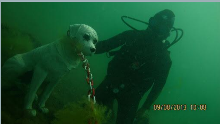
Одеський підводний музей