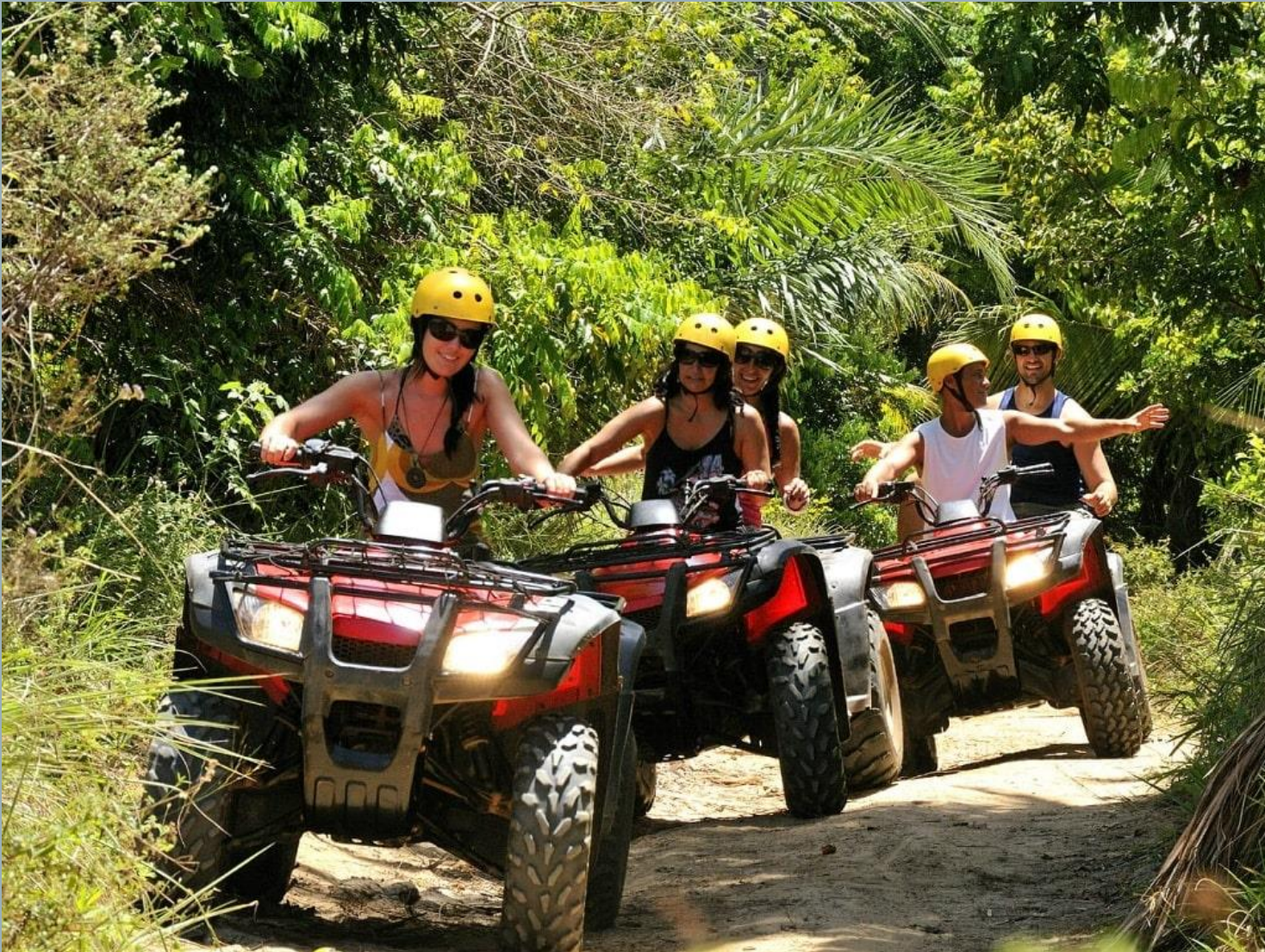
Сафарі на квадроциклах