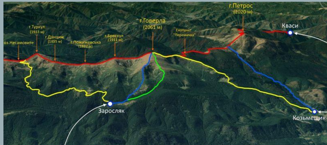
Складність маршрутів при підйому на Говерлу

Туристичні підприємства зобов'язані інформувати туристів про потенційні ризики, пов'язані з кожною конкретною туристичною послугою, та забезпечувати їм профілактичні заходи.