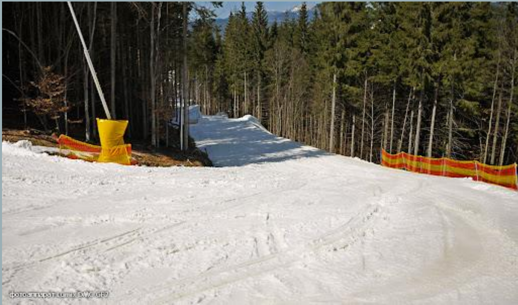
Облаштування траси в Буковелі

Для забезпечення безпеки громадян здійснюються різні заходи, зокрема, встановлення огорож уздовж туристичних стежок та маршрутів, оснащення захисними засобами канатних доріг, гірськолижних трас.