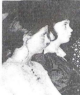
Ці дівчата також наші...

- Я з Донецької області, - каже Сашко Дубинка. І часто згадую своїх вчителів зі школи, особливо літніх, досвідчених. З ними, порівняно з молодими вчителями, що працювали у