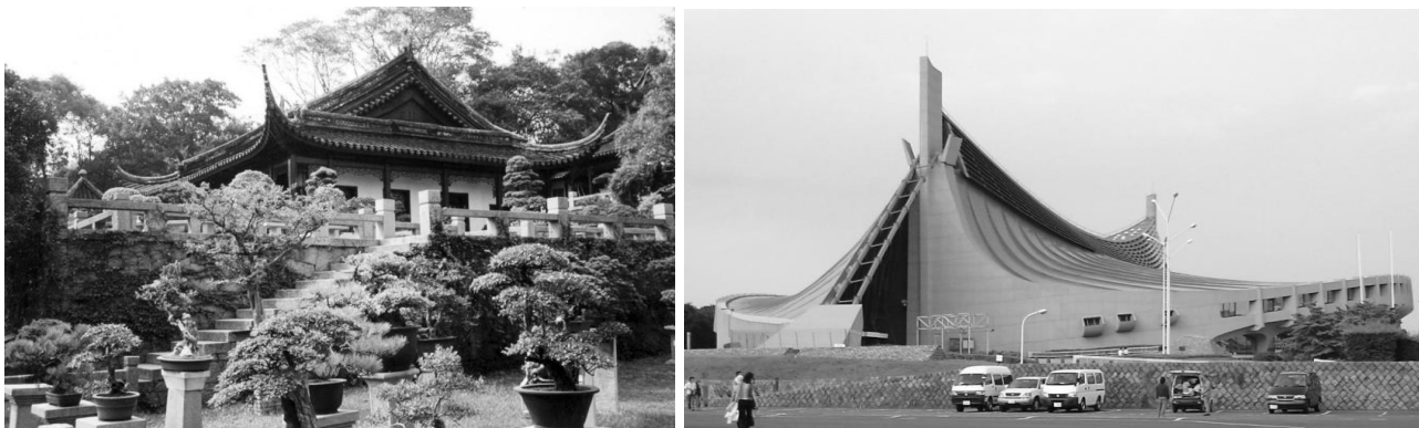
Рис.1. Архітектура стародавньої китайської цивілізації та архітектура Японії XXI століття.

Довгий час Японія була позбавлена відкритих торговельних шляхів з сусідніми країнами, тому до середини дев'ятнадцятого століття вся архітектура була виконана з бамбука і дерева. Головними образами архітектурних рішень того часу були: лісові та тваринні мотиви. Вже після того як 8 січня 1989 року в країні настає ера Heisei Японія переходить на новий етап загального розвитку, в тому числі і архітектури. З новою владою композиційні рішення японської архітектури починають злегка змінюватися, але художні форми і концепції все так само частково запозичуються з стародавньої китайської цивілізації та древньої японської культури, як це було раніше. На рис. 1 зображено архітектуру стародавньої китайської цивілізації та архітектура Японії XXI століття.