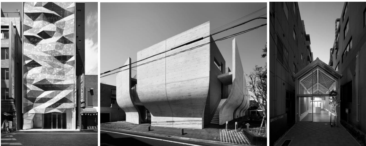
Рис.2. Комерційний офіс «Dear Ginza», будинок «Breeze» в Токіо та Ogimachi Global Dispensing Pharmacy в місті Осака.

стародавньої композиції внутрішнього простору; натхненність та емоційність; філософські думки, котрі проявляються в кожному архітектурному об'єкті; головна ідея автора та його мислення; чуттєвість та гармонія. Вникаючи в образність архітектурних об'єктів розумієш: це творилося з любов'ю, з повним розумінням ідеї та філософії, з бажанням показати людині красу з іншого ракурсу. Не дарма багато критиків в галузі мистецтва кажуть: японська архітектура чутлива, такою вона залишається і по сьогоднішній день. Потрібно мати неймовірну силу, щоб зуміти пережити величезну кількість змін та скрізь декілька епох залишатись такою неймовірною. На рис. 2 показано декілька найзнаменитіших архітектурних об'єктів Японії за період з 2012-2015 роки.