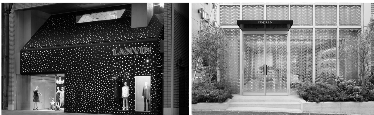
Рис.3. "Lanvin Boutique" і Glass Jewelry Box в Токіо.

Про роботи компанії Хіроші Накамура пишуть в газетах, архітектурних видавництвах, інтернет ресурсах. Не дивно, адже в проектах компанії є щось незвичайне. Архітектуру, - над якою працює бюро Накамури, - легко впізнати і неможливо забути. Хіроші розробляє проекти з неймовірною красою і витонченістю. Він не боїться експериментувати з формою об'єкта, будівельними матеріалами, внутрішнім простором споруди. Улюблене напрямком Накамури - житлові будинки. Архітектор приголомшливо об'єднує стародавню канонічну архітектуру Японії з сучасністю і новими потребами людей. Він майстерно володіє композиційними прийомами перетікання простору. На рис. 3 показано кілька об'єктів від компанії Hiroshi Nakamura & NAP.