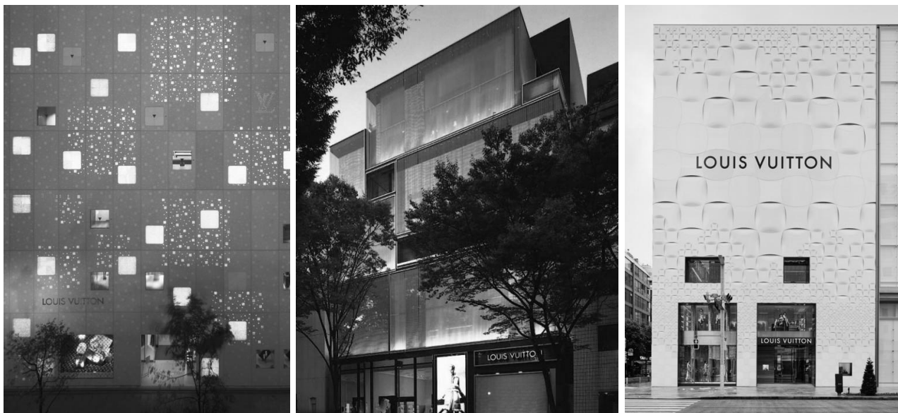
Рис.4. Магазины Luis Vitton від компанії Aoki Jun & Associates.

На сьогоднішній день архітектура Аокі дуже популярна в Японії. Джун зумів не тільки втілити в життя колосальну кількість проектів, але й потрапити в найпопулярніші всесвітні журнали. Архітектор опублікував досить велику кількість статей власного написання, наукові дослідження, монографії, особисту книгу «Jun Aoki Notebooks». Основні риси архітектурного образу Аокі: видозмінений конструктивізм, цілісність думки, краса форм, духовне насичення, переосмислений концепт складних ідей. За час роботи компанія Aoki Jun & Associates вдихнула життя в більше п'ятдесяти різних проектів. Улюбленого напрямки, або переваги в проектуванні бюро Аокі не має, тому в їх виконанні можна побачити як житловий будинок для однієї сім'ї, так і магазин всесвітнього бренду. Завдяки своїй чутливій і прагматичній архітектурі, Аокі зумів сподобатися всесвітньому дому моди Louis Vitton. Незабаром бренд Луї Віттон вирішив побудувати в Японії мережу своїх магазинів звернувшись до бюро Aoki Jun & Associates. Таким чином, виникла ціла серія проектів Louis Vitton від Аокі Джуна. На рис. 4 показано кілька магазинів Louis Vitton від компанії Aoki Jun & Associates.