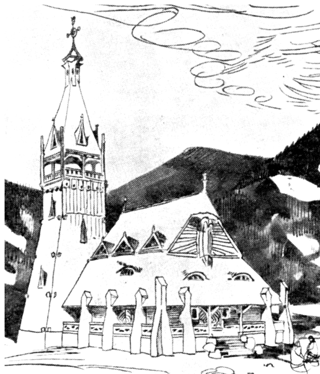
Рис. 2. Проект дерев’яної каплиці 1905 р. у Верховині Івано-Франківської обл. [1, с. 242; 11]

Творчість архітекторів, які проектували курортні будівлі, позначилась і на сакральній архітектурі цих поселень. Так, яскравим прикладом наслідування „норвезького” стилю був нереалізований проект дерев’яної громадської каплиці 1905 р. у Верховині (Жаб’є) Івано-Франківської обл. арх. Франциска Мончинського [1, с. 237] (рис. 2), який гармонійно доповнив архітектурні риси модерну та сецесії. Аналогом міг послужити проект дерев’яного костелу 1887 р. в Никирці (Швеція) архітектора Е.-А. Якобсона, позначився на вирішенні вежі та хреста на її завершенні, різьбі на краях гребенів даху, мансардних віконечок (рис. 3–а). Аналогом міг також бути дерев’яний скандинавський костел в Кіруні (1900–1912 рр.) архітектора Густава Віцкмана, з нього почерпнуто фігури на схилі даху, стовпи галерей – у вигляді контрфорсів (рис. 3–б) [1, с. 242].