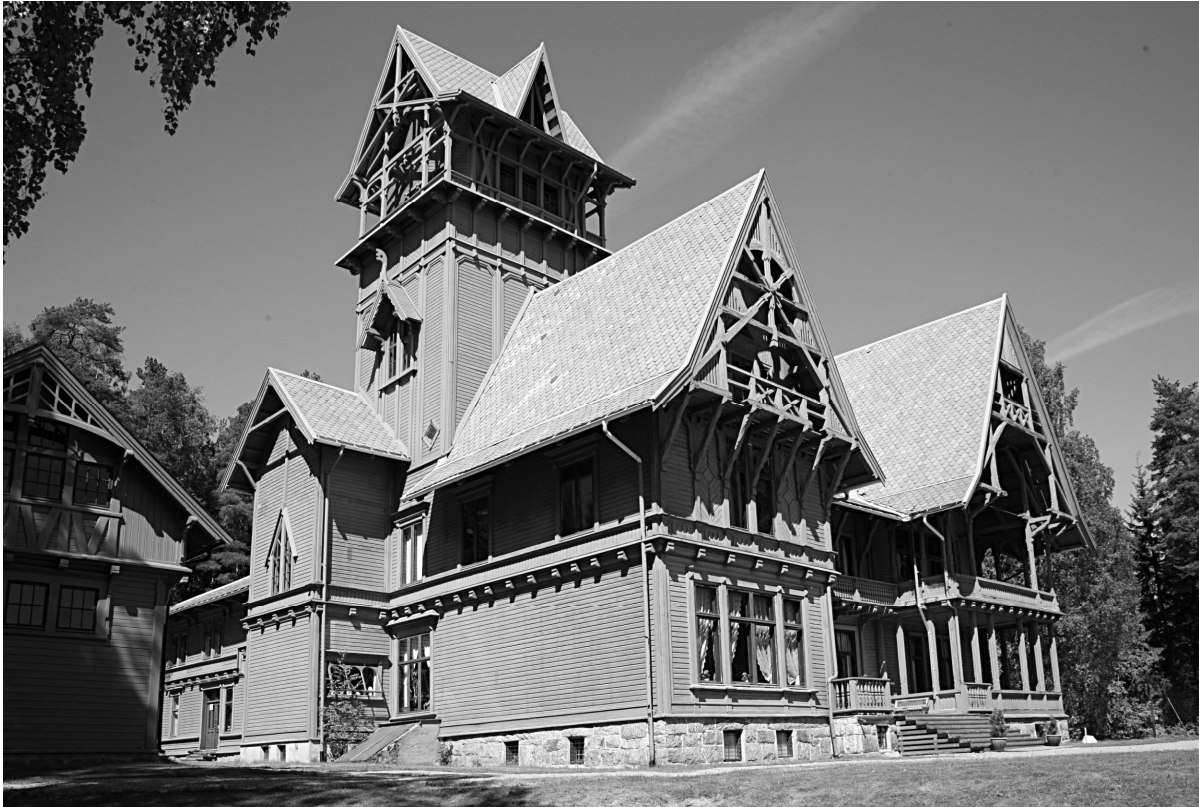
Рис. 1. Вілла „Фредгейм” в Норвегії. Фото [17].

Варто зазначити, що на формування „норвезького” стилю вплинув „швейцарський”, який охопив Скандинавські країни, особливо Норвегію та Швецію. Так, досліджувані об’єкти були багатодекоровані дерев’яною різьбою, яку в кінці XIX ст. пропагували в Європі, видаючи каталоги із прикладами дерев’яного народного зодчества, типовими проектами чи яскравими прикладами проектів архітекторів тощо. Наприклад, – виданий в Німеччині тритомник Б. Лібольда [6]. Низка особняків була побудована на теренах Стокгольмського архіпелагу у 1860–1915 рр. згідно проектів відомих архітекторів (напр. Адольфа Фредеріка Вільгельма Шоландера). Найбільш ранні зразки „швейцарського” стилю були представлені вже в 1839 р. у замковому парку в Осло за проектами арх. Ганса Франциска фон Лінстова. У Фінляндії вже в 1844 р. відзначився Ернст Бернхард Лорманн. Яскравим прикладом віллової забудови є вілла „Фредгейм” в Норвегії, в архітектурі якої гармонійно поєднано „норвезький” та „швейцарський” стилі (рис. 1) [17].