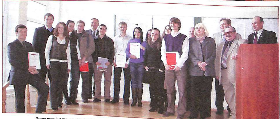
Переможці конкурсу курсових проєктів HERZ-2008 з дисципліни "опалення" із викладачами та комісією.