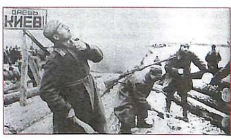
Київ звільняють з-під окупації