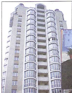
Будинок по вул. Волынська, 9а