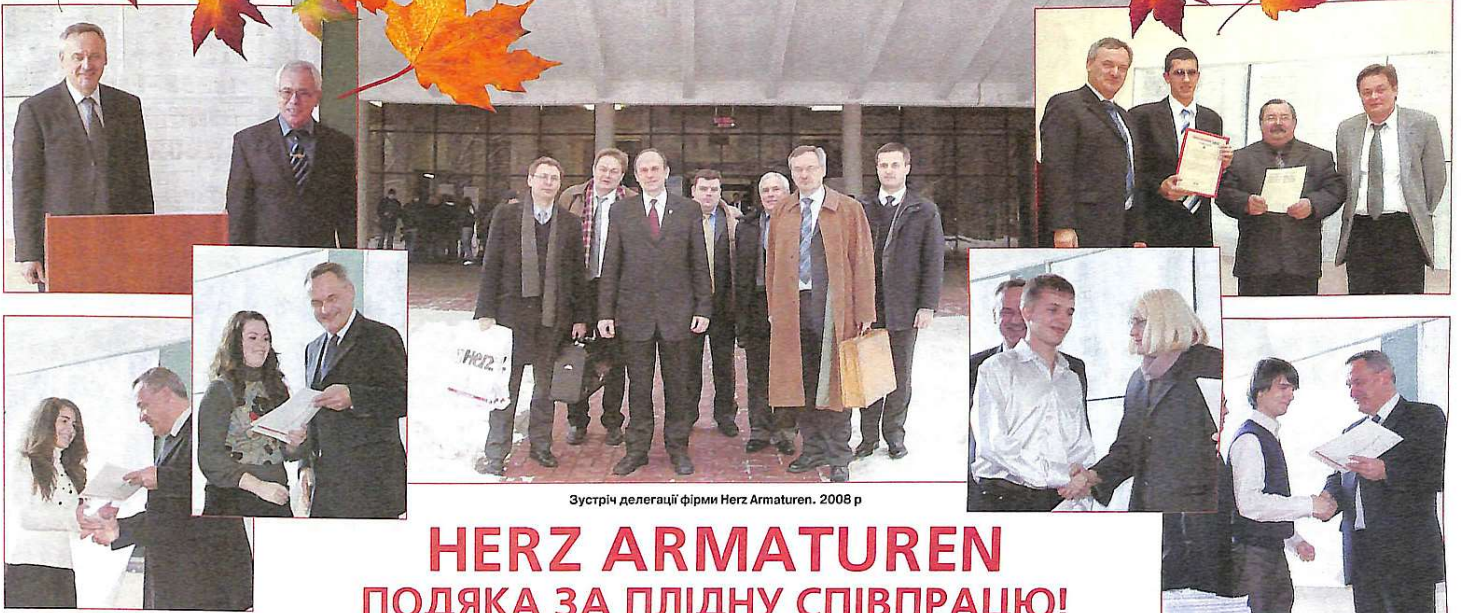
Зустріч делегації фірми Herz Armaturen. 2008 р.