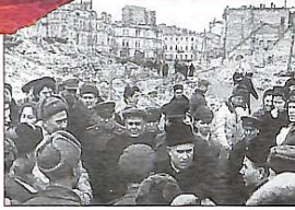
М.Хрущов у звільненому Києві. 6 листопада 1943 року

Фронт швидко наближався до Києва. 1 липня 1941 почалася евакуація великих промислових об'єктів військового значення, установ, фахівців, членів родин радянського командного, партійного складу. До початку вересня 1941 р. евакуювали 197 великих підприємств, 32 вищих і середніх спеціальних навчальних закладів, науково-дослідні інститути. У липні 1941 року було прийнято рішення про евакуацію нашого інституту