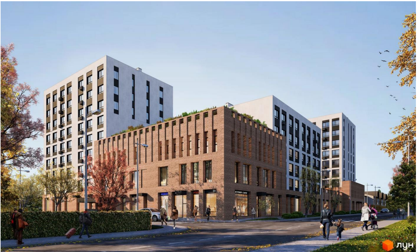
Рис 2.2. Візуалізація житлового комплексу.