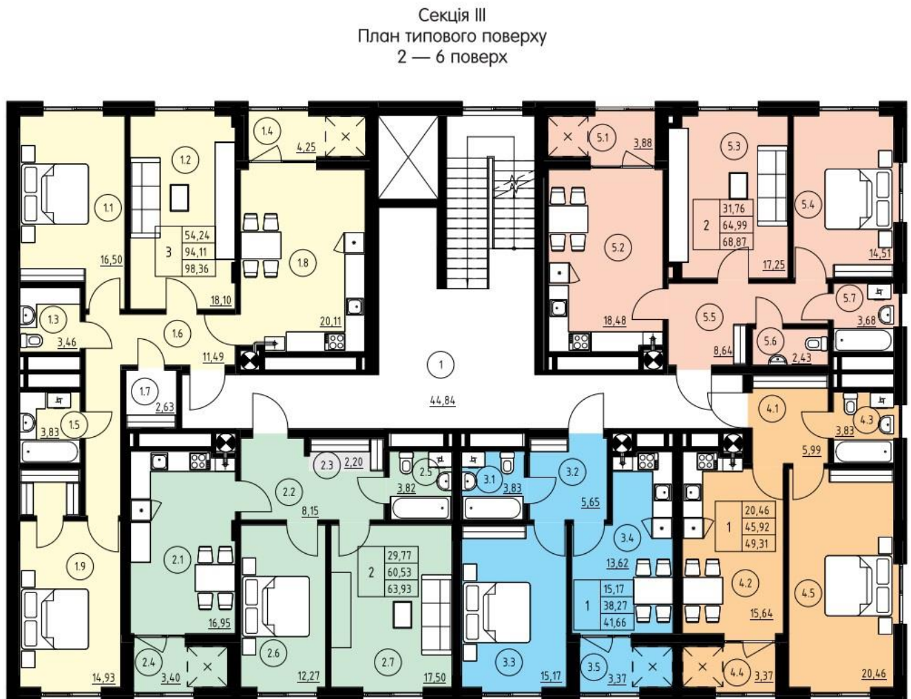
Рис. 2.4. План поверху будівлі.

- Ванна кімната та кухня в кожній квартирі мають зручне розташування для підключення до центральних комунікацій.