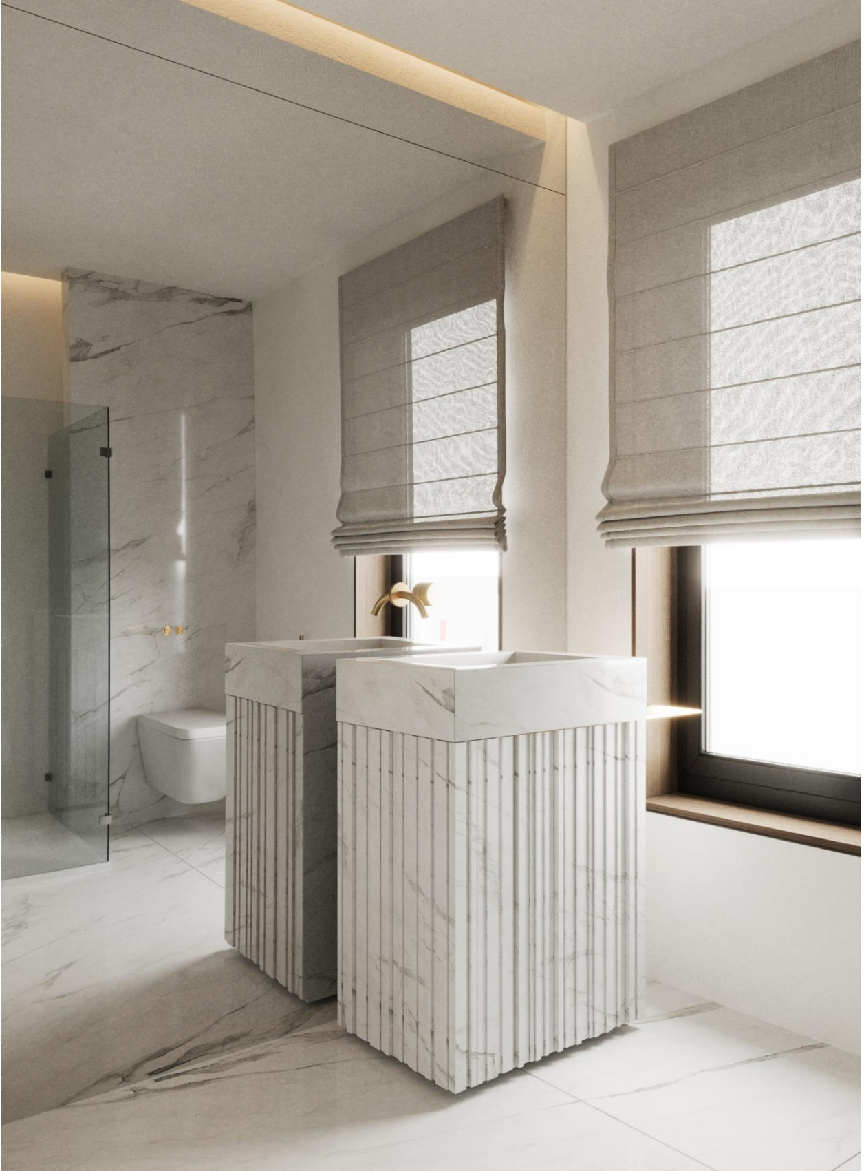
Рис. 3.3. Раковина