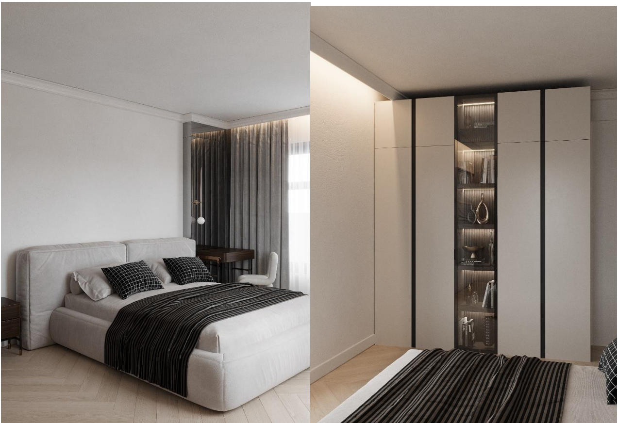
Рис. 2.8 та 2.9 Візуалізації