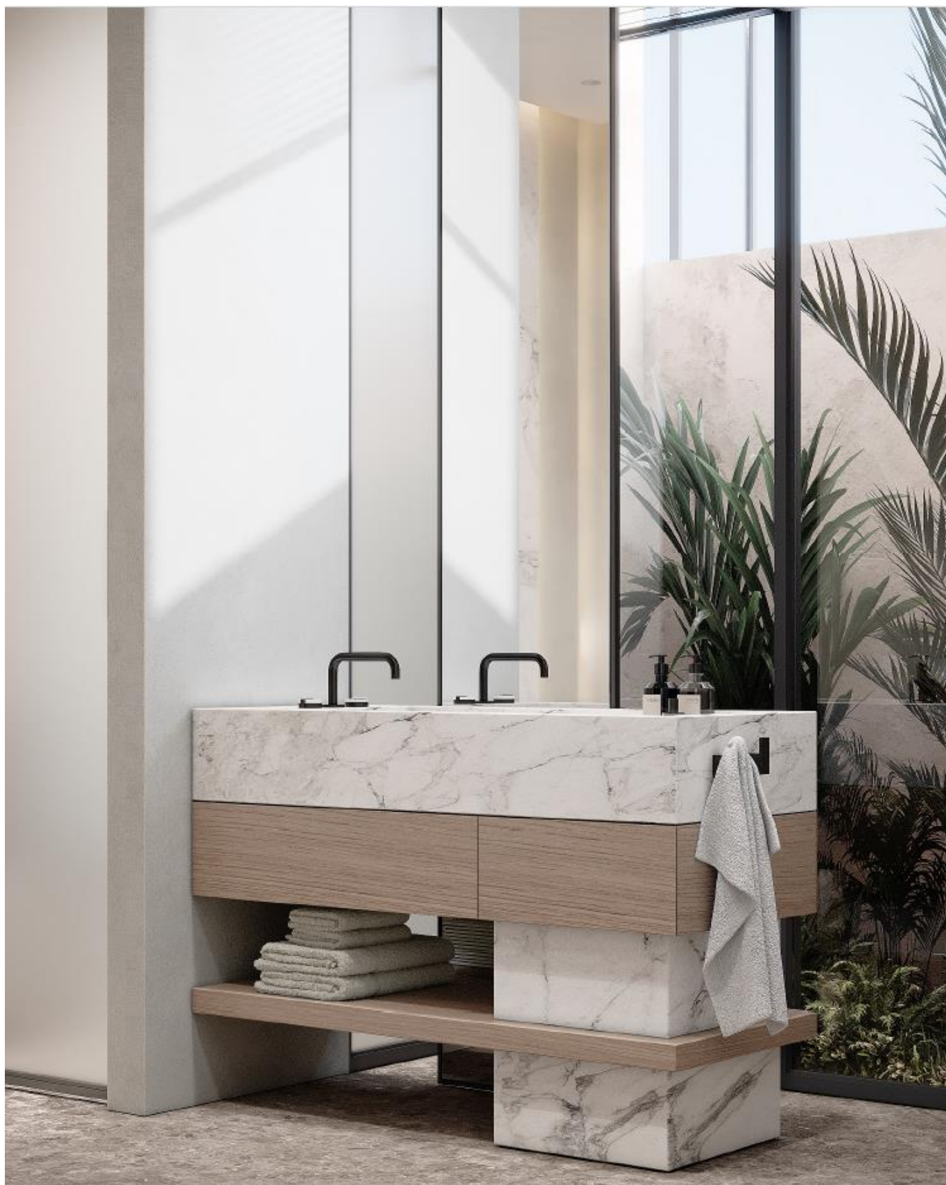
Рис. 3.2. Раковина

Як аналог окремостоящому умивальнику є ось такий виріб (Рис. 3.2. Раковина).