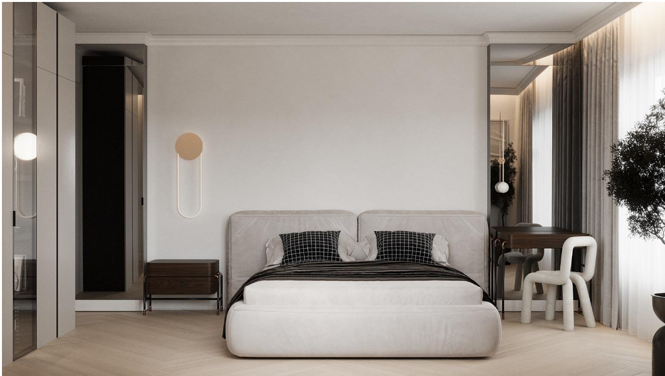
Рис. 2. 8 Візуалізації дитячої кімнати

Смарт-технології інтегровані в усі освітлювальні прилади, дозволяючи з легкістю керувати освітленням за допомогою голосових команд або смартфона, що додає зручності і сучасності в інтер'єр.