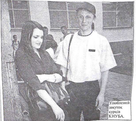
Улюблений закуток курців КНУБА.