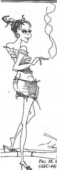
Рис. М. Сивашової, (АБС-44)