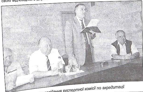
Закличне засідання експертної комісії по акредитації

Також плідно співпрацюємо з Технічним університетом міста Брауншвейг. Наприклад, обмінюємося студентами з метою знайомства з системою навчання, з культурою. За участю цього університету створена громадська організація "Німецьчина—Україна—Брауншвейг", яка допомагає нашим співвітчизникам отримати вищу освіту з врахуванням німецьких правил і вимог. Ця організація бере на себе певне матеріальне забезпечення наших студентів в Брауншвейському університеті: вони оплачують проїзд, проживання і ін. А навчання — безплатно. До кожної такої групи входить 3—5 студентів. Вимога одна — знання німецької мови. Викладачі з Брауншвейга приїжджають до нас і самі відбирають студентів.