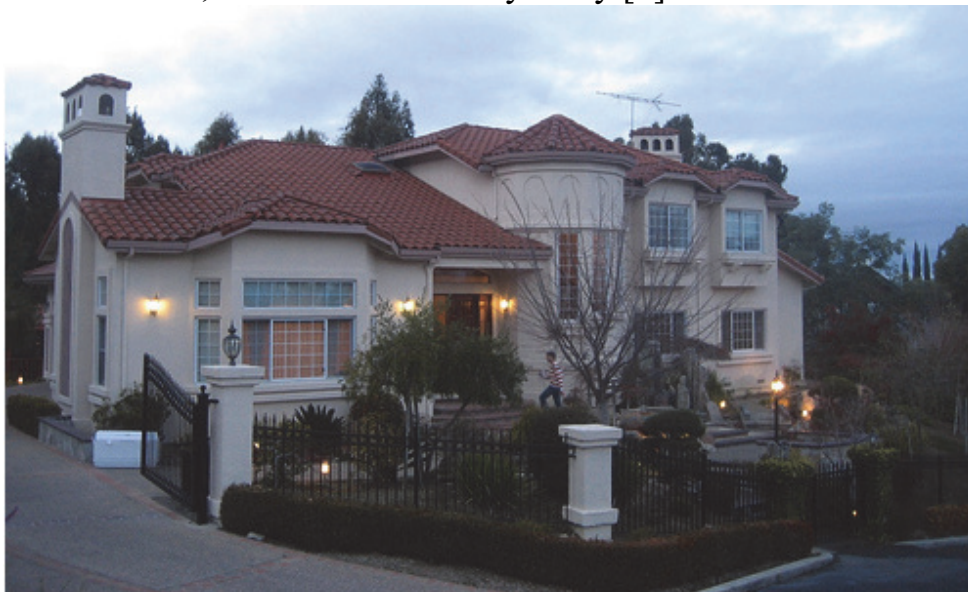
Рис. 3 The Rainbow Mansion в Купертіно

Rainbow Mansion в Купертіно (рис.3) Пізніше цей особняк став домівкою для безлічі молодих і талановитих людей з Google, Apple, Tesla та інших корпорацій. Сам формат став тиражуватися, після чого колівінгі стали з'являтися в інших американських містах, а потім і по всьому світу [3].