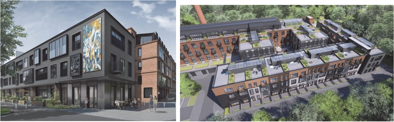
Рис. 4,5 колівінг CO_LOFT в Москві

Криза міського житла є дуже реальною проблемою, тому колівінг не тільки обслуговує «цифрових кочівників», він служить набагато більшій економічній меті в забезпеченні житлом молодих професіоналів, які не можуть дозволити собі або не хочуть брати іпотечний кредит, і втомилися від оренди та боротьби з арендодавцями. Колівінг також сприяє відчуттю спільності і підтримує більш активну співпрацю.